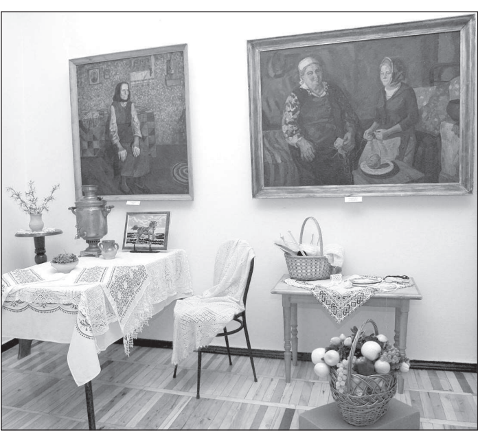
Произведения живописи гармонично дополняют образцы прикладного искусства: народные куклы-обереги, оригинальная вышивка, чудесные оренбургские платки, яркая керамика. Воссоздан уголок домашнего быта - накрытый стол, корзины с фруктами, предметы вязания, самовар... Эта непритязательная, но очень душевная экспозиция дает возможность еще и еще раз показать, как дороги нам наши мамы и бабушки.