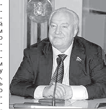
Депутат Государственной Думы Российской Федерации В. В. ЗИНОВЬЕВ.

ЭТОТ негромкий, но очень светлый и добрый праздник дает нам возможность задуматься о главных человеческих ценностях, выразить бесконечную признательность матерям, которые подарили нам самое дорогое, что есть у человека - жизнь!