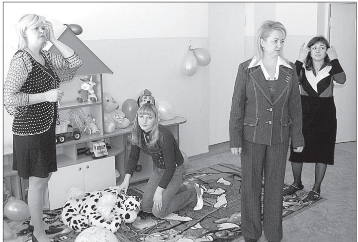
● Сотрудники детского сада «Солнышко».

Д ЕЛО в том, что здание неподалеку от станции Минутка построили еще в 1987 году. Это был последний типовой детский сад, который возвели в городе-курорте. Но и его, когда разразился постсоветский кризис, у детешек забрали. Многие годы там квартировал филиал областного местного бюджета поступления от аренды муниципального здания были не лишними. Но в прошлом году новая глава города-курорта Наталья Луценко решила расторгнуть договор аренды и вернуть здание детям. Власти присвоили новому садку первый номер, поскольку некогда существовавшее возле колоннады детское дошкольное учреждение под таким номером кануло в Лету. - Ну а название «Солнышко» мы уже сами придумали, - рассказывает заведующая Елена Фадеева. - Наш детский сад прежде всего нацелен разгрузить соседнее ДОУ № 19, где в очереди более 200 человек. В новом детском саду планируют разместить 160 ребят, но пока здесь работают только две группы из шести. Сказываются десятилетнее пребывание в здании сторонней организации: многое нужно отремонтировать, перестраивать. Уже то, что хотя бы ясельные группы открыли, достижение. Вот уж поминисте всем миром старались. Управле-