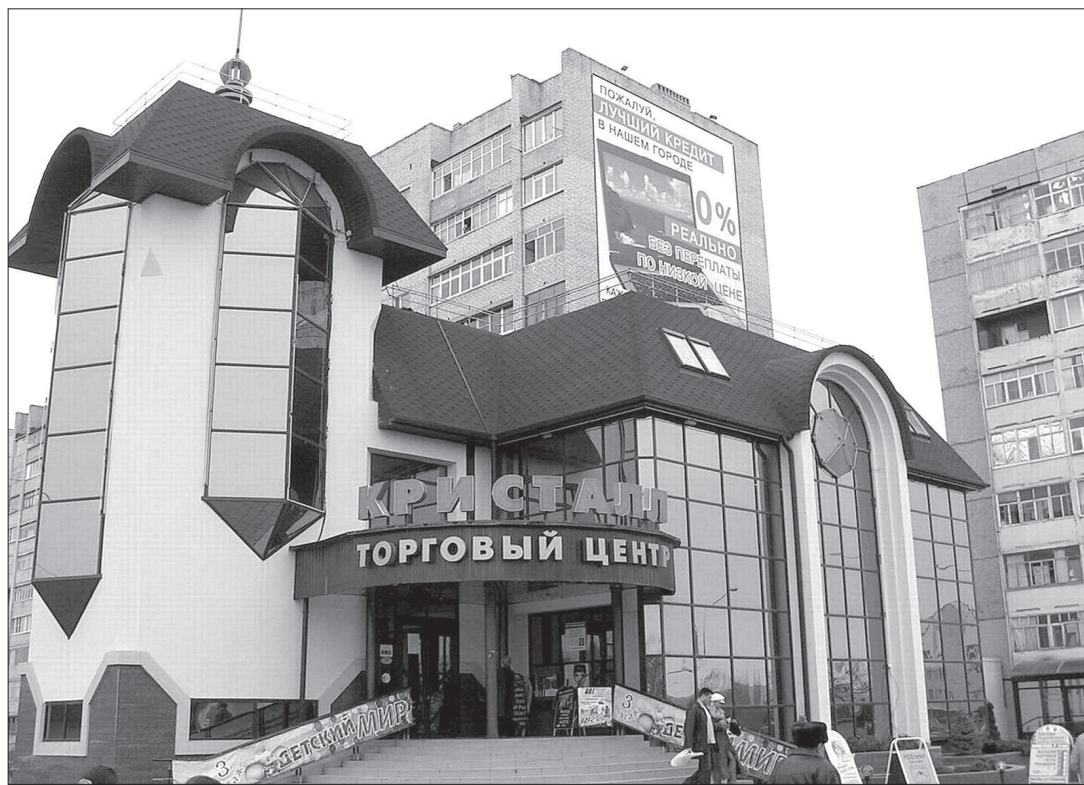
● В структуре предприятий малого бизнеса в Невинномысске пока что львиную долю занимает торговля.

В ЭТОМ шла речь на отчетном собрании совета предпринимателей Невинномысска. Проблем немало. Взять торговые монополисты, в роли которых выступают федеральные ритейлеры. На прилавки их магазинов местным товаропроизводителям пробиться нелегко. Да и «плата за вход» составляет немалую сумму. В итоге страдают невинномысские производители мясных изделий, пенья, соков, консервов и т. д. А также мелкие торговцы, чей бизнес, задавленный монополистами, становится нерентабелен. Число небольших магазинов и соответственно - рабочих мест снижается. Причем потери эти, считают деловые люди Невинномысска, намного больше, чем число вакансий в федеральных торговых сетях. Еще один немаловажный момент: эти сети уплачивают налоги по месту регистрации, ком. Ставрополье не является.