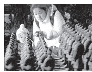
стран в Китае шоколад распространился совсем недавно, и местная молодежь лишь начинает проникаться любовью к заморскому лакомству.

Поводом для открытия тематического шоколадного парка послужило растущее число любителей этого лакомства среди китайцев. Теперь они смогут почитать шоколадную сказку, имитирующую волшебную фабрику из повести Роальда Даля. Создатели шоколадной страны чудес, разместившейся в китай-