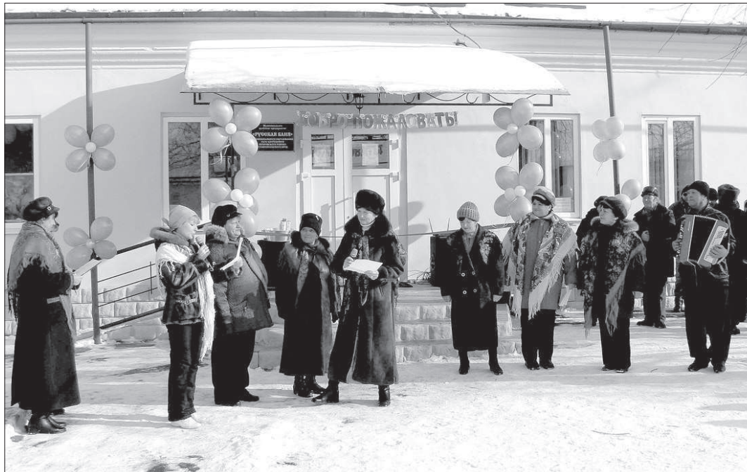
В Петровском районе произошло незаурядное доселе событие — здесь открылась первая сельская муниципальная баня.