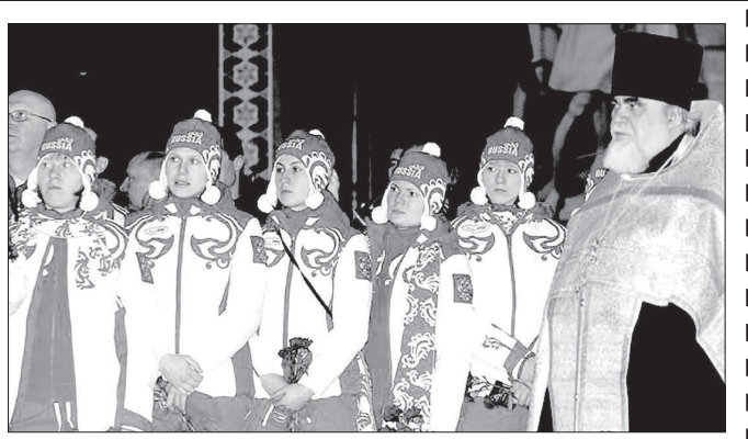
В храме Христа Спасителя состоялась торжественная церемония проводов Олимпийской сборной на Игры в Ванкувер.