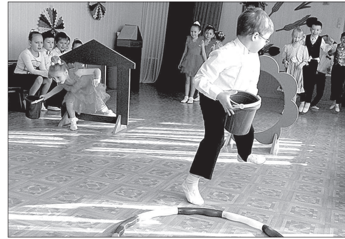
ОЛЕГ ДЕГТЯРЕВ.

«Пусть помнит каждый гражданин - пожарный номер 01». Под таким девизом в Ставрополе на базе детского сада № 56 прошел праздник пожарной безопасности среди воспитанников детских садов.