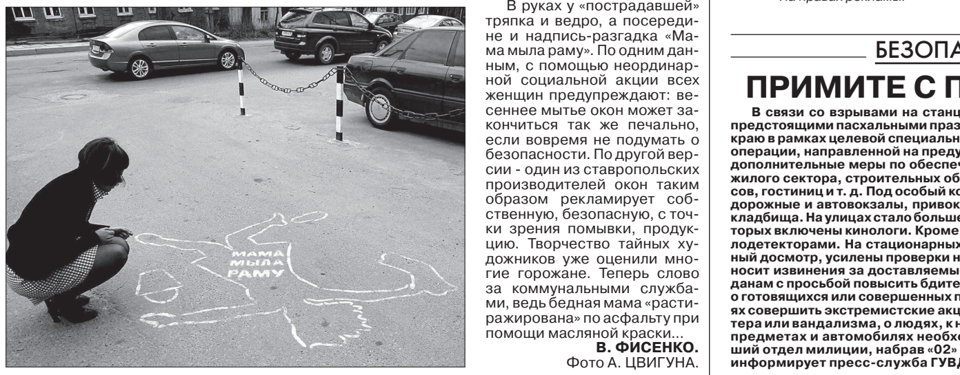
Необычный рисунок появился вчера на дорогах и тротуарах практически во всех районах Ставрополя: он изображает контур женщины, якобы упавшей с высоты.