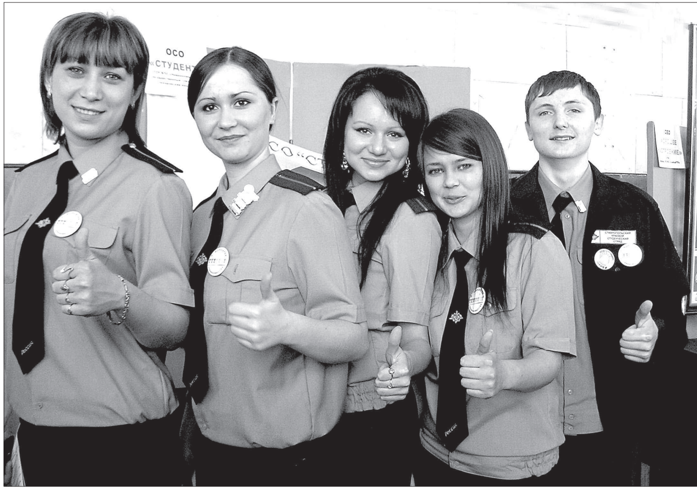
У волонтеров всегда хорошее настроение.

У каждого волонтерского отряда - своя специализация. Например, отряд «Студент» Невинномысского государственного гуманитарно-технического института занят охраной порядка на различных мероприятиях, проводимых в вузе. Отряд «Наши сердца» Невинномысского химического колледжа в основном занят благотворительной деятельностью. Как рассказали студенты, недавно они помогли собрать деньги на операцию тяжелой больной де-