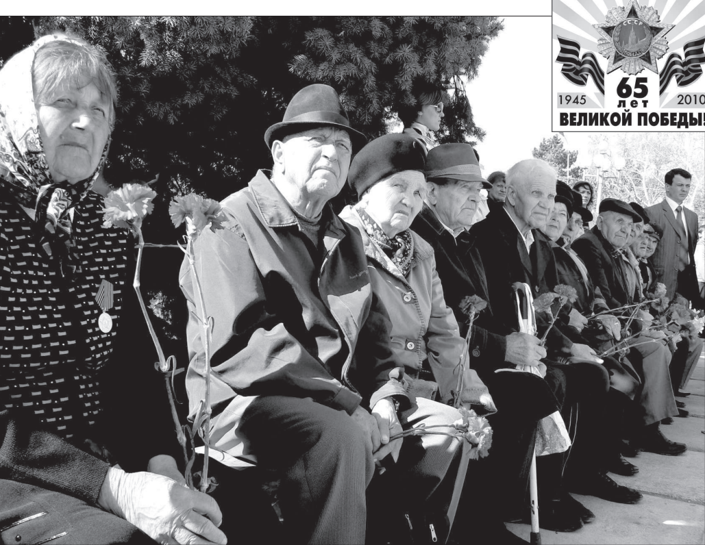
65 лет ВЕЛИКОЙ ПОБЕДЫ! 1945-2010

В минувшую пятницу у Огня вечной славы в Ипатово было много людей. На самом почетном месте - ветераны, чьи одежды украшают ордена и медали. Горожане собрались по необычному и торжественному поводу - чтобы отправить послание потомкам.