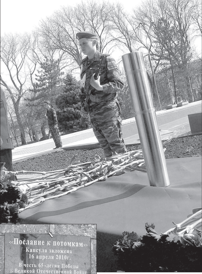
«Послание к потомкам» - капсула заложена 16 апреля 2010г. В честь 65-летия Победы в Великой Отечественной войне 1941-1945гг. Вскрыть в 2045 году, в честь 100-летия Победы в Великой Отечественной войне 1941-1945гг.