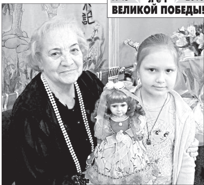
● Кукла в подарок госте.