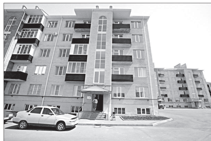
Новый микрорайон, где теперь будут жить переселенцы.