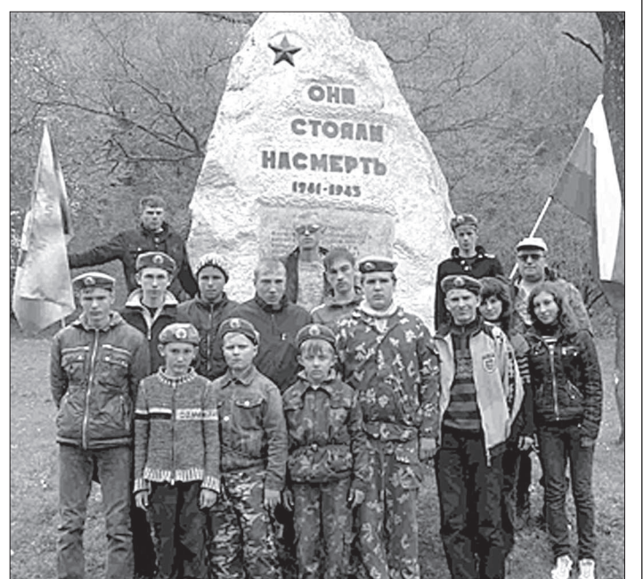
Члены поискового отряда «Истоки» школы села Большая Джалга Ипатовского района приняли участие в краевой туристско-краеведческой акции «Вахта памяти».