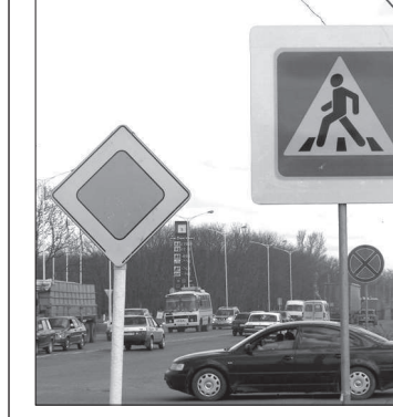
Знаки спасут жизни.

На федеральной автодороге «Кавказ», проходящей по окресткам Невинномыска, появились дорожные знаки на цитах, покрытых флуоресцентной пленкой. Они информируют автомобилистов о наличии пешеходного перехода. Не заметив больше, яркие, светящиеся в темноте объекты дорожной инфраструктуры невозможно. Следовательно, значительно снижается вероятность наезда на пешеходов. Новинка появилась в результате совместной инициативы дислоцированного в Невинномыска отдельного батальона дорожно-патрульной службы (ОБДПС) ГИБДД ГУВД Ставропольского края и дорожных служб. Пока что в черте города установлено два комплекта новых знаков. Началась их установка и на других участках, обслуживаемых батальоном.