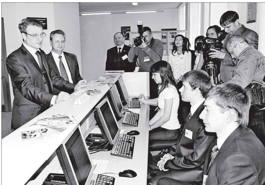
● Визит председателя правления Сбербанка России Германа ГРЕФА в лабораторию «Мини-банк».

Для закрепления практических навыков студенты проходят производственную практику на ведущих предприятиях, в хозяйствах и компаниях различного профиля. Среди партнеров вуза Газпромбанк, «Ставхолдинг», «ЮГПРОМ», предприятия «Кавказтрансгаз» и «Невинномысский Азот», комбайновый завод «Ростсельмаш», концерн «Энергомера», холдзинг «Россия», «Колос» и др. Есть и другие примеры сотрудничества с работодателями. Так, на базе лаборатории «Мини-банк» открыт филиал Учебного центра Северо-Кавказского банка Сбербанка России, где совместно с преподавателями Ставропольского ГАУ реали-