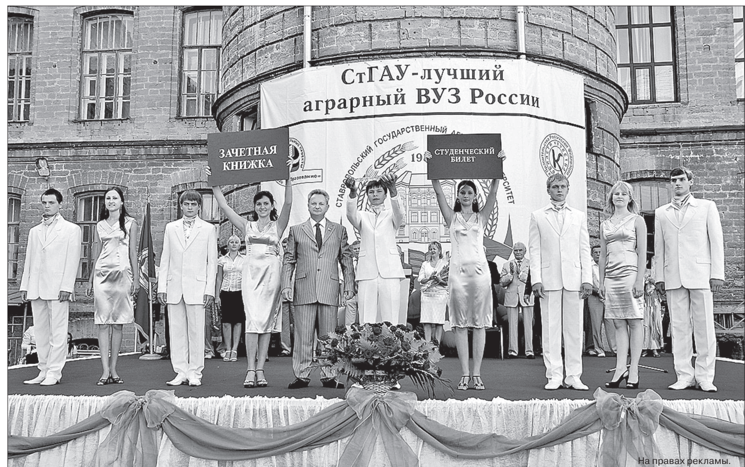
● Посвящение в студенты на празднование Дня знаний.

ПОДТВЕРЖДЕНИЕМ высокого качества предоставляемых вузом образовательных услуг является неизменно высокий конкурс среди абитуриентов (в 2010 году в целом по университету он