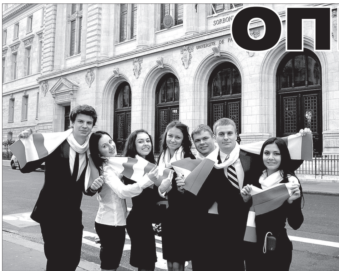
● Делегация Ставропольского государственного аграрного университета на Российско-французском студенческом форуме в Париже.

Свой юбилей Ставропольский ГАУ встречает как один из лучших инновационных вузов страны. Сегодня его руководство ставит амбициозные, но реально выполнимые задачи. Для этого у него есть богатый потенциал: человеческие и материальные ресурсы, ясное понимание того, каким образом и как будут решаться новые масштабные, грандиозные задачи.