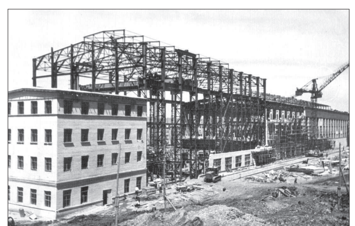
Так все начиналось. Компрессорное крыло объединенного корпуса аммиака. 1960 год.

И, наверное, не случайно почти совпали две знаменательные даты: 185-летие Невинномыска и 50-летие со дня объявления ЦК ВЛКСМ строительства Невинномысского азотно-тукового завода. Всеобщей ударной комсомольской стройкой. Более трех тысяч молодых рабочих приехали в сонный провинциальный городок, а по сути – казачью станицу. Там, где вчера еще была ковыльиная степь, на глазах вырастали корпуса гиганта большой химии. Стремительно рос и город, ставший вскоре промышленной столицей Ставро-