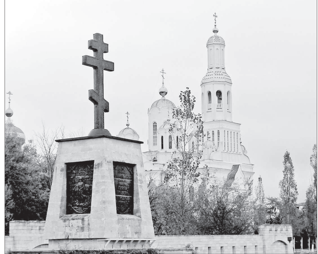
Собор Покрова Святой Богородицы - духовный центр современного Невинномыска.