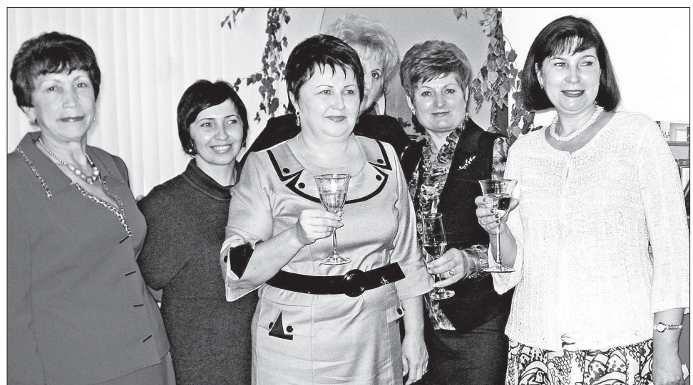
● Чествование тружениц племязавода.