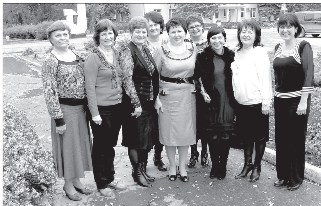
● Ими гордится хозяйство.