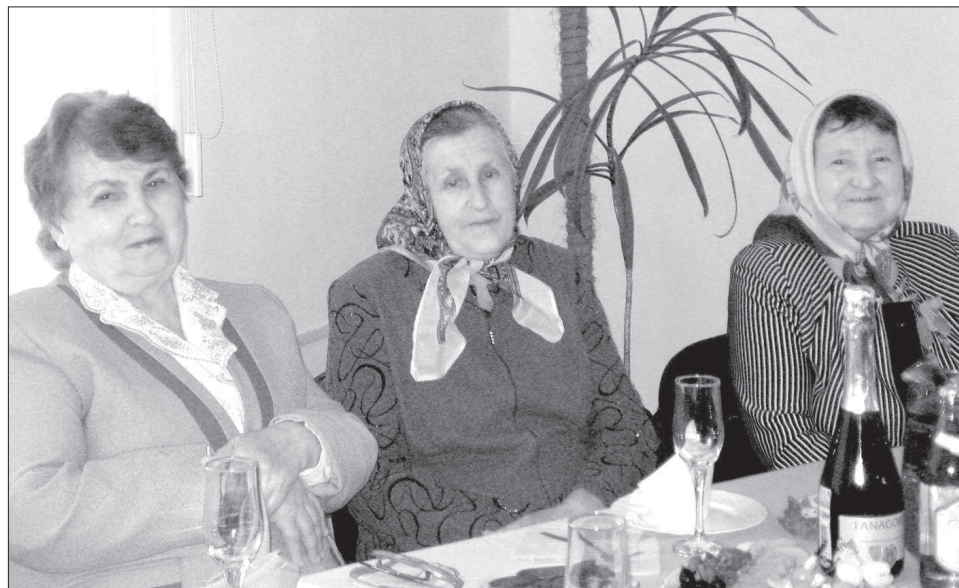
● Праздничный огонек.

На входе развернулась выставка работ местных мастериц. Умеют они рисовать, вышивать, вязать, игрушки ма-