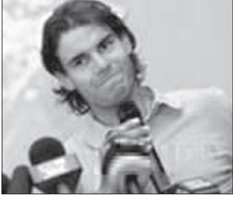
За звание лучшего спортсмена поспорят испанский теннисист Р. Надаль (на снимке), немецкий автогонщик С. Феттель, филиппинский боксер М. Пахья, американский баскетболист К. Брайант, а также футболисты «Барселона» - испанец А. Иньеста и аргентинец Л. Месси. Спортсменкой года могут стать теннисистки С. Уильямс из США, К. Клейстерс из Бельгии и К. Возняцки из Дании, американская горнолыжница Л. Вонн, а также легкоатлетка Д. Эннис из