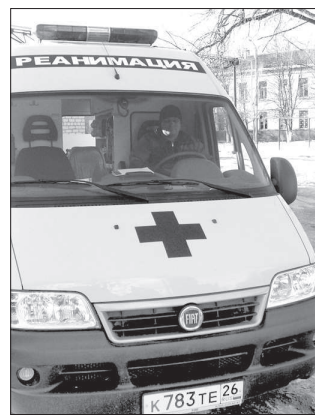
● Реанимобиль поможет спасти сотни жизней.

Каждый год в России в автоавариях гибнет более 25000 человек. Смертность на наших дорогах почти в четыре раза превышает среднеевропейские показатели - не в последнюю очередь из-за того, что в регионах не налажена четкая, эффективная система оказания медицинской помощи при ДТП.