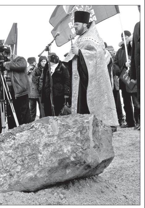
● Камень на месте будущего ледового дворца освятили.