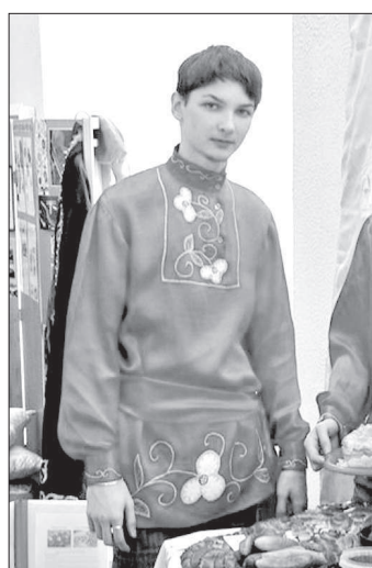
туркменского народов: в музыке, песнях и танцах звучал «голос» степных просторов. Кстати, артисты из Кавсулы и Озексуата уже «ветераны» фестиваля, они запомнились зрителям и красивыми национальными костюмами, и профессиональным выступлением.

Как мы уже сообщали, прошел зональный фестиваль национального искусства «Мир на нефтекумьской земле»