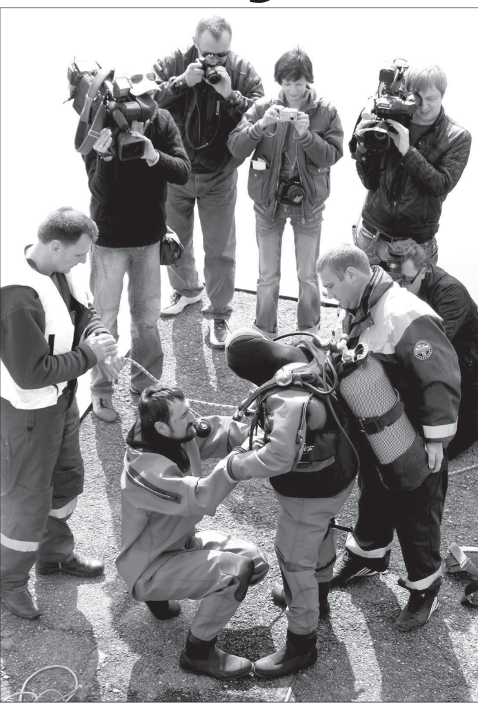
Ф. КРАЙНИЙ.