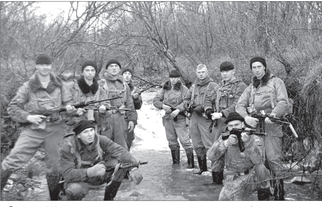
Чечня, 1999 год. Разведывательный взвод готовится к выполнению боевого задания.