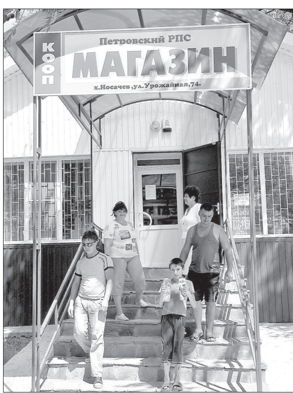
Кооперативный магазин на хуторе Носачев Петровского района.