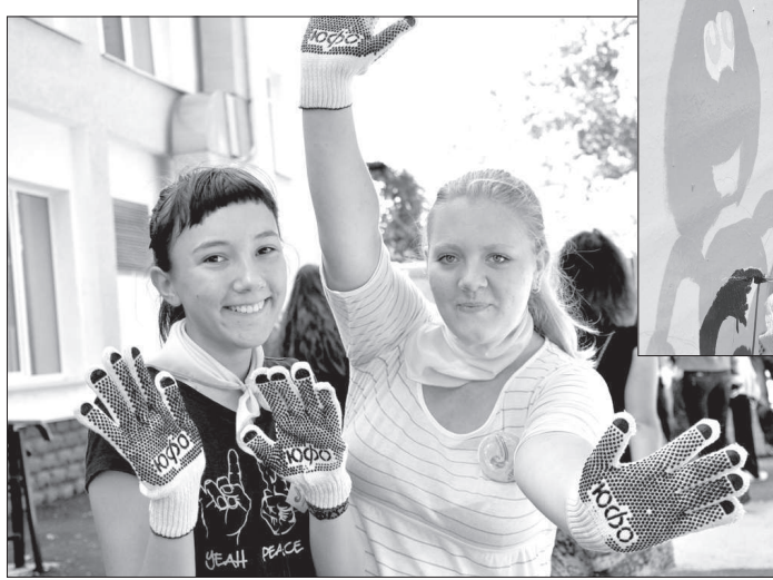
В. НИКОЛАЕВ.