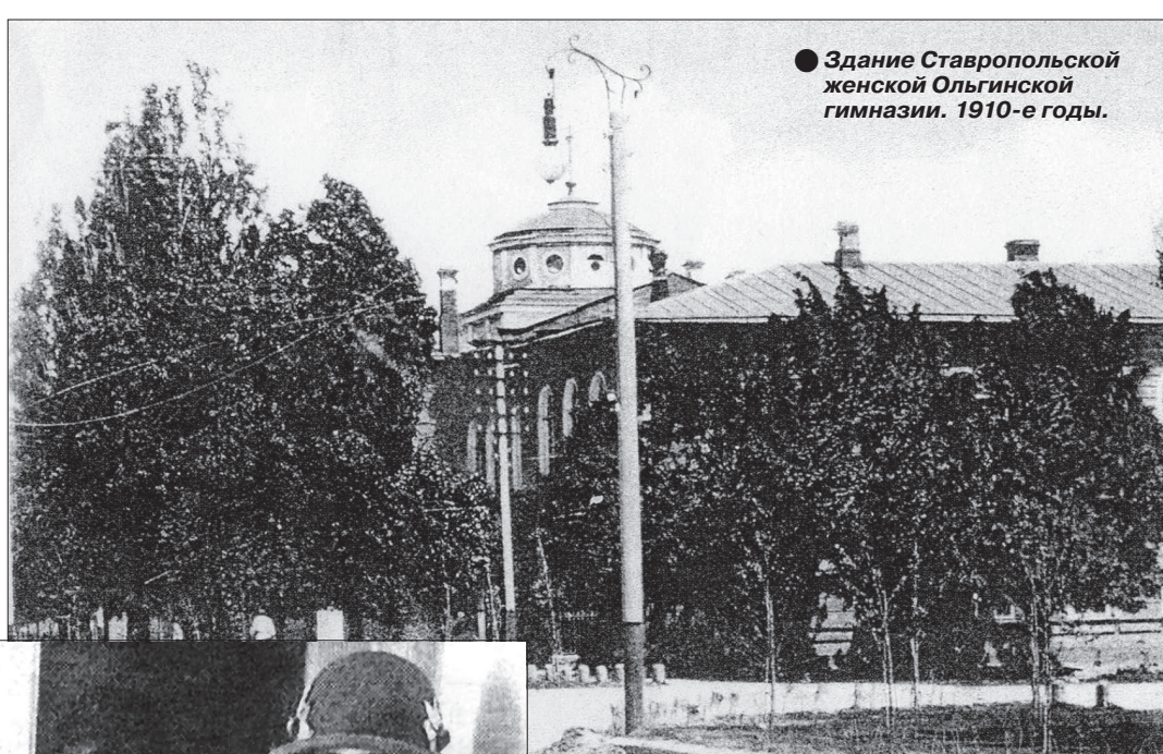
Здание Ставропольской женской Ольгинской гимназии. 1910-е годы.

За парты сели 75 учениц - дети разночинцев, мещанского и купеческого сословий. Согласно уставу заведения тогда составляло из трех основных и одного подготовительного классов. Непросто поначалу было даже оснастить школу всем необходимым, в том числе учебниками, так как в Ставрополе еще не было ни одного книжного магазина. Вскоре, в июле 1862 года, училище получило степен 1-го разряда и стало шестиклассным. Поводом