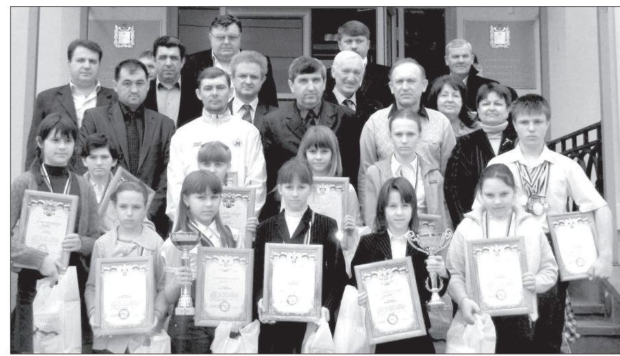
● Юные спортсмены на приеме в администрации.

В целях создания условий для развития творчества детей и молодежи, а также для организации досуга и обеспечения услугами организаций культуры жителей нашего района в текущем году продолжается реализация ведомственной целевой программы «Развитие и сохранение культуры и искусства Ипатовского муниципального района Ставропольского края на 2010-2012 годы». В 2010-2011 гг. из бюджета района на мероприятия программы выделено 13,8 млн рублей.