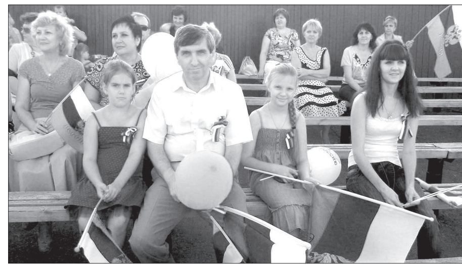
● На праздновании Дня российского флага.