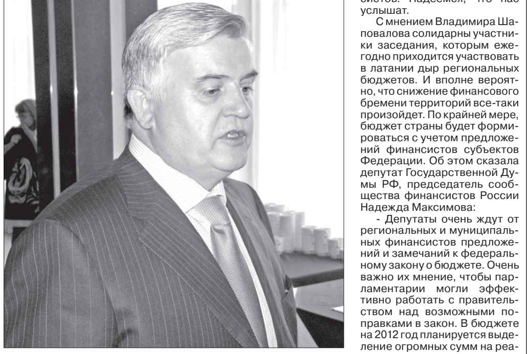
(на нижнем снимке) - Например, сегодня наш регион формирует дорожный фонд, и приходится рассчитывать на муниципальные бюджеты, которые сами нуждаются в средствах. Опять же, необходимо выполнять указ Президента РФ о повышении зарплат учителям. При этом обделенными остались педагоги дополнительного образования и медицинские работники, которые не попали в программу модернизации

здравоохранения. Мы за счет краевого бюджета решаем все эти вопросы. Берем займы, повышаем дефицит бюджета. Конечно, учителя, педагоги дополнительного образования, врачи не останутся без доплат. Но хотелось бы внимания именно от инициатора новых федеральных программ, финансирования из бюджета РФ. Вот такие вопросы мы ставим перед правительством страны от сообщества финан-