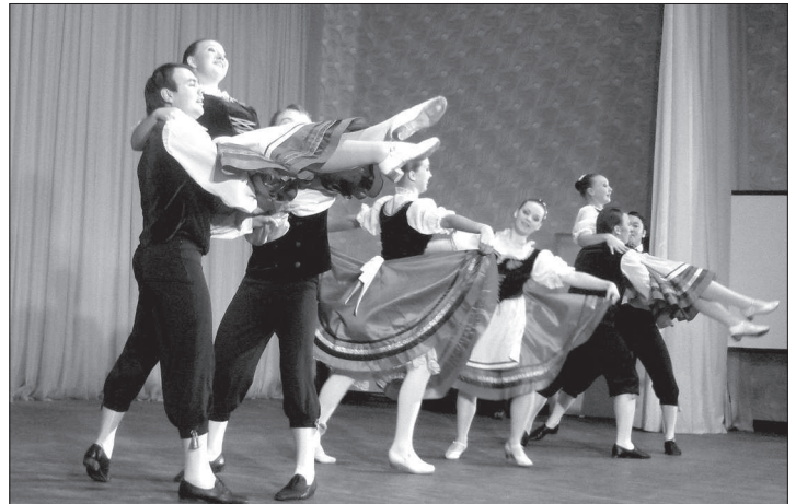
Искрометные танцы омских «Югенд».

ИСТОРИЧЕСКАЯ судьба российских немцев сложилась так, что вслед за Москвой, Петербургом и Поволжьем наиболее значительные и многочисленные их общины образовались в Сибири. Вот и выступили на Кавминводах Международный союз немецкой культуры пригласил творческие коллективы из далекого таежного края.