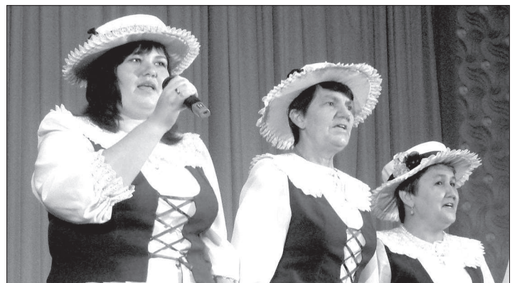
Тюменские вокалисты на кисловодской сцене.

В рамках Дней немецкой культуры в Российской Федерации в большом зале Кисловодской музыкальной школы имени Рахманинова состоялся концерт