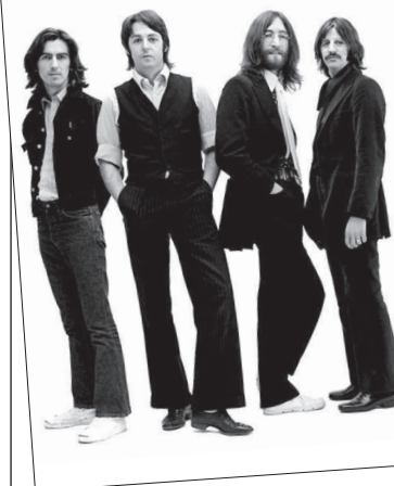
Д. ЛЕННОН: «Мы просто записали эту песню. Поскольку я знал аккорды, я играл на клавинооргане. Джордж играл на скрипке, потому что так нам хотелось, а Пол – на контрабасе.»

«ВСЕ, ЧТО ВАМ НУЖНО, – ЭТО ЛЮБОВЬ» Ты не сможешь сделать то, чего невозможно сделать. Ты не сможешь спеть то, что невозможно спеть. Тут ничего не скажешь, Но ты можешь научиться играть по правилам – это легко. Ты не сможешь создать то, чего невозможно создать. Ты не сможешь спасти того, кого невозможно спасти. Тут ничего не поделаешь, Но ты можешь научиться появляться вовремя – это легко. Все, что тебе нужно, – это любовь, Все, что тебе нужно, – это любовь, Все, что тебе нужно, – это любовь, Любовь – это все, что тебе нужно. Ты не сможешь узнать то, что неизвестно. Ты не сможешь увидеть того, чего не видно. Ты не сможешь обидеть там, где тебе не суждено побывать, – Все просто. Все, что тебе нужно, – это любовь.