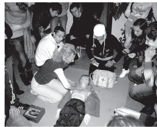
Работа секции ОБЖ.

Она проводилась для того, чтобы помочь ребятам лучше подготовиться к региональному этапу Всероссийской предметной олимпиады школьников 2011-2012 гг.