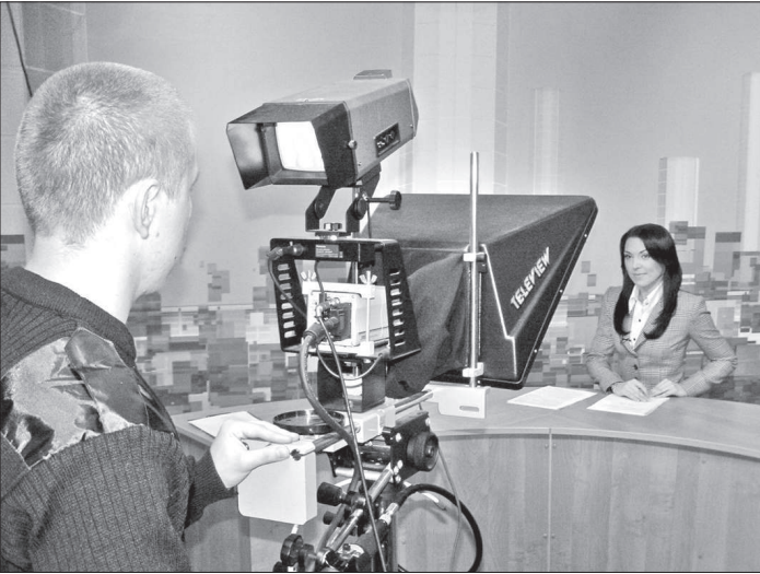
Из новостных программ телекомпании «Телетекст» невинномысцы узнают обо всех последних событиях в городе.

Бывают в жизни удивительные совпадения. Двадцать один год назад, 21 ноября 1990 года, начала вещание в Невинномысской студии кабельного телевидения «Телетекст».