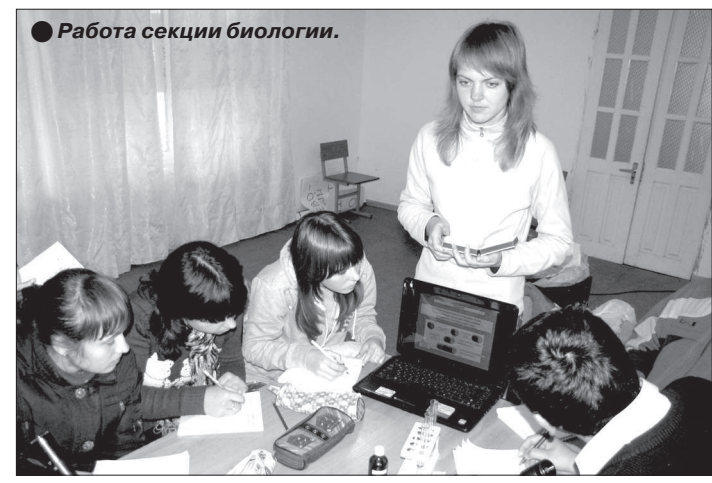
Работа секции биологии.