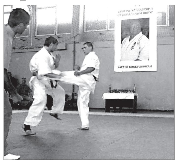
Полный контакт - под присмотром судей и великого мастера.

Ставропольские ребята и девочки им не уступают. В последние годы на различных соревнованиях в СКФО ставропольская команда почти всегда становилась либо призером, либо победителем.