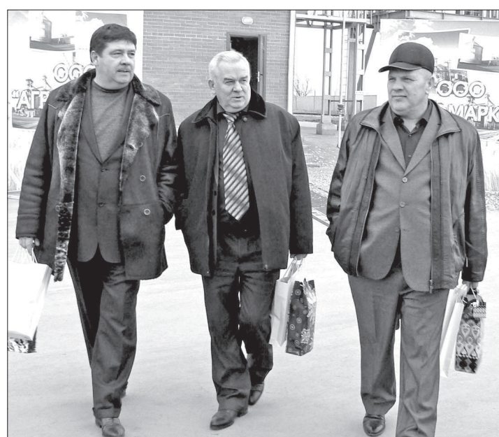
● Давние партнеры «АГРОМАРКЕТА» - представители СПК «Родина».

На счету агрокомпании много добрых дел, говорящих о настоящем патриотизме. Работа о семьях сотрудников, совмест-