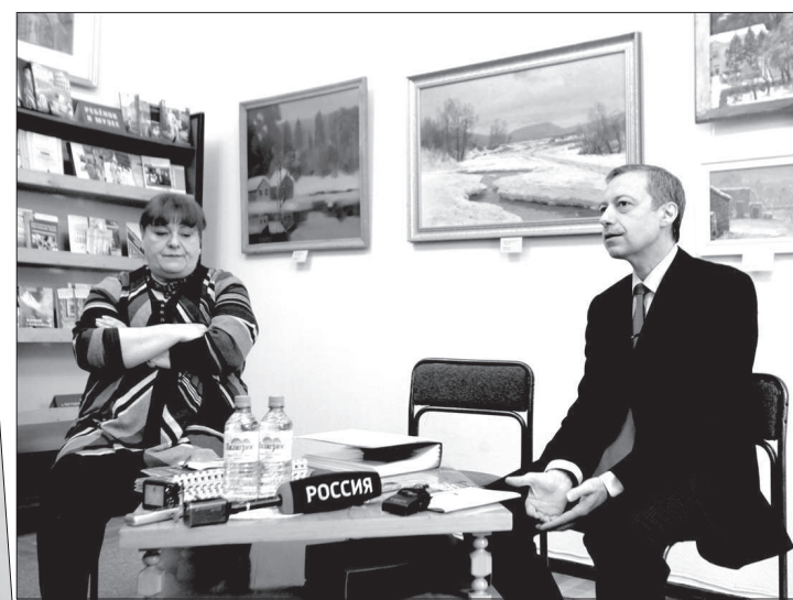
важным в вашей судьбе, может «посоветовать» вам что-то такое, что потом вся жизнь пойдет наперекосяк... Дали, наоборот, все показывает в перспективе, у него события происходят во времени и пространстве, но его время - в котором нет начала и конца...

- Мы стремились отразить два принципиально разных творческих пути Дали и Пикассо: Пикассо все выводит на один план, все герои выставлены в один ряд, на авансцену. Определить, кто главный, сложно, автор намеренно показывает «театр жизни» таким, где любой, даже самый малозначимый, персонаж может оказаться принципиально