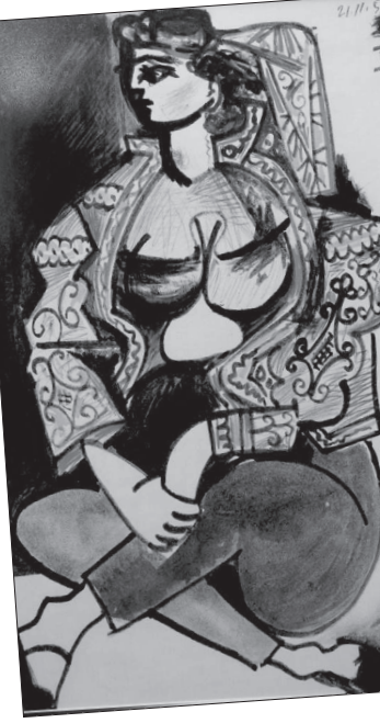
страсти Сальвадора Дали к Священному Писанию. Теперь вот Дали в соседстве с Пабло Пикассо.