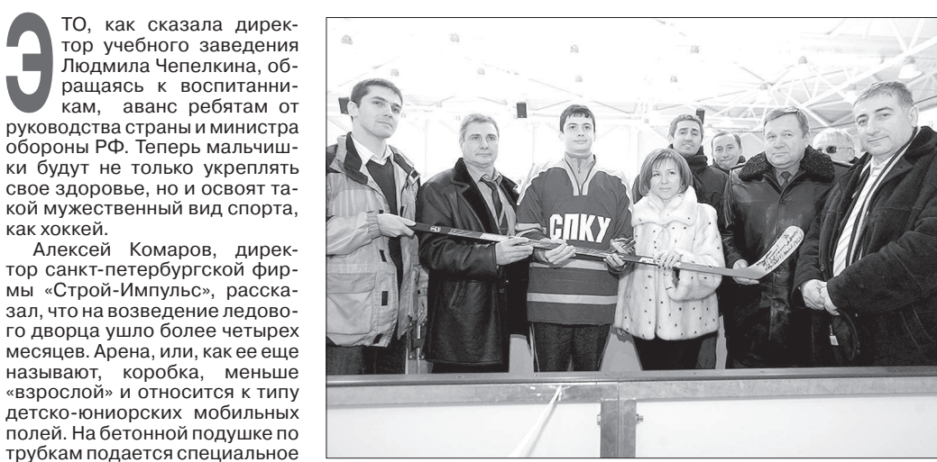
На открытии дворца были приглашены представители химического вещества, охлаждающего воду, и таким образом намораживается лед. Для этого объекта лед готовился трое суток и теперь останется на долгое время (даже если на улице летом жара перевалит за сорок градусов), и лишь время от времени он будет шлифоваться машиной, чтобы снова стать гладким.