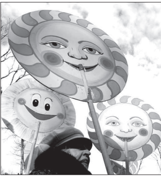
Строились снежные городки, которые разрушали в субботу, как бы показывая, что конец пришел снегу и льду. В пятницу,

НАПОМИНИМ, что история празднования предстоящего дня весеннего равноденствия зародилась еще в языческие времена. Считается, что румяные блины символизируют Солнце, а сжигание соломенного чучела - конец зимы. По церковным канонам, Масленица - время примирения с близкими, прощения обид и подготовки к Великому посту. По традиции семь дней - с 20 по 26 февраля - положено веселиться. Причем каждый день недели имеет свое название, которое рассказывает о том, что полагается делать.