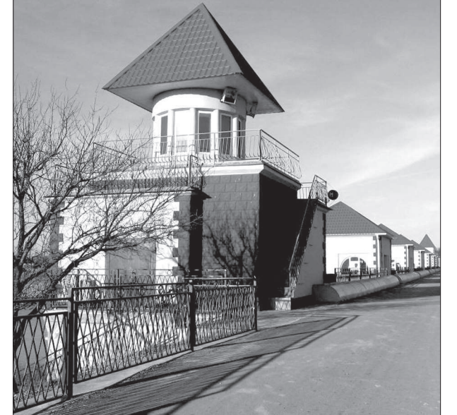
Главное сооружение Невинномысского канала. На переднем плане - та самая «пирамида Хеопса».