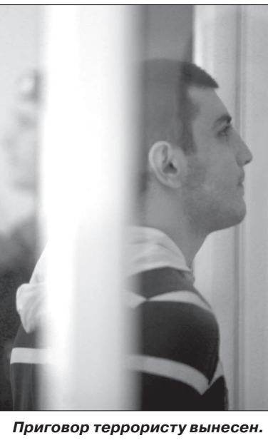
● Приговор террористу вынесен.