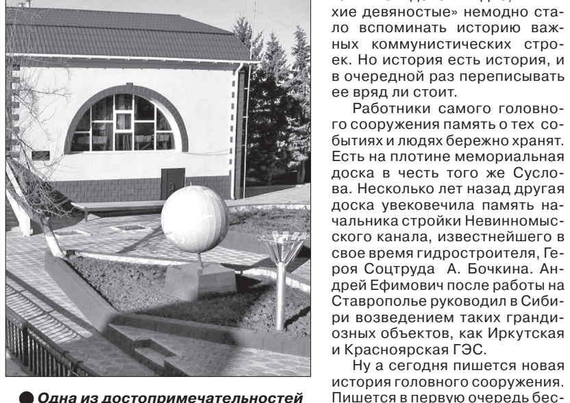
Одна из достопримечательностей плотины - большой глобус с нанесенной на него трассой Невинномысского канала.

Строили в свое время важные объекты, как говорится, на века. Вот и катастрофическое наводнение 2002 года головное сооружение выдержало с честью, тогда как, например, мосты, возведенные в 70-е годы, взбесившаяся Кубань ломала как спички. Горожане, видя, как напирала огромная волна воды на плотину, не сомневались в том, что ее смоев. Пошли даже неслышанные о боевых самолетах, которые подняли в воздух для бомбардировки плотины.