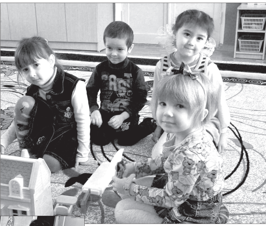
В игровой комнате.