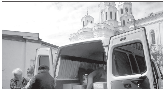
● Общая стоимость благотворительного груза, прибывшего в Невинномысск, - без малого пять миллионов рублей.

В адрес Невинномысского благочиния из Московской области пришла детская фура с детским питанием.