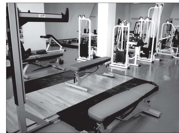
Тренажерный зал с оборудованием мирового уровня.

В прошлом году в кисловодский спорткомплекс мы вложили около 70 миллионов рублей. Появился фактически новый легкоатлетический стадион с прыжковым сектором, сектором для метания и прекрасными беговыми дорожками. Оборудованы современные тренажерные залы. Построена кроссовая трасса, недавно на ней успешно прошёл Кубок России. Федерация легкой атлетики планирует проводить на этой трассе чемпионаты Европы и кубки мира по кроссу. На кисловодскую верхнюю базу уже переехала наша сборная по спортивной ходьбе. Та самая, которая на Олимпиаде в Пекине завоевала две золотые медали, а на последнем чемпионате мира - еще три «золота». Для них на верхней базе будет создана отдельная диспансариум. Улучшены условия проживания, питание спортсменов. В соответствии с поручением министра спорта, туризма и молодежной политики РФ Виталия Мутко, который поставил задачу сделать в Кисловодске лучший в мире центр спортивной подготовки, разработана концепция олимпийской базы, привлечены проектировщики из «Спортинженеринга».