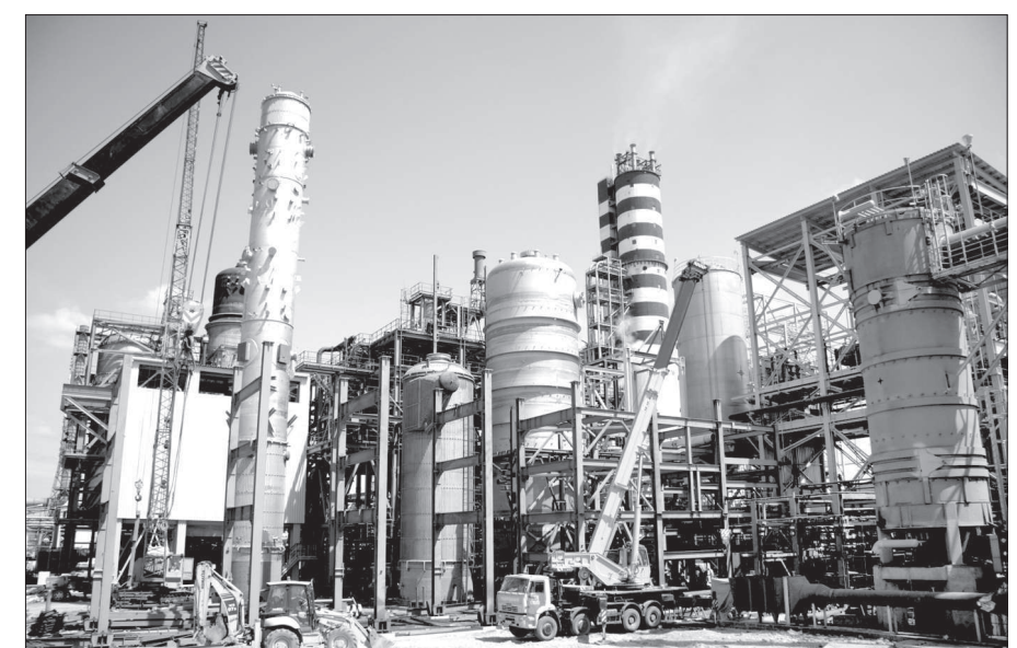
Установка по производству меламина.

С ЦЕЛЬЮ полного, объективного информирования жителей Невинномыска о запуске первой в России установки по выпуску меламина на ОАО «Невинномысский Азот» на днях минерально-химическая компания «ЕвроХим» открыла в городе общественную приемную.