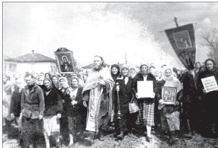
● Церковное шествие в День Победы в селе Новоалександровском.