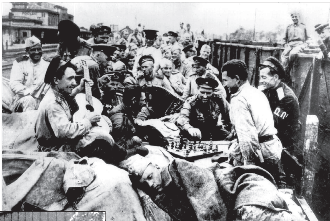
● Возвращение домой.

На первой полосе «Ставропольской правды» 9 мая 1945 года рядом с Указом Президиума Верховного Совета СССР с объявлением Праздника Победы и постановлением Совнаркома СССР о признании 9 мая нерабочим днем опубликованы волнующие сообщения о том, что происходило в домах и на улицах Ставрополя, в городах и селах края. К трем часам ночи обычно тихо утопающий в предутреннем мраке город вдруг ожил, в окнах загорелись огоньки. Со всех концов, даже с самых далеких окраин, потянулись люди в центр, где зажгли факелы, у домов, в огородах запылали костры, началась стрельба из охотничьих ружей, слышались гудки со стороны завода «Красный металлист» и железнодорожного вокзала, зазвучали гармошки. Женщины, совершенно незнакомые, бросались друг другу в объятия, плакали и целовались. Встречая рассвет победы, группа крепких