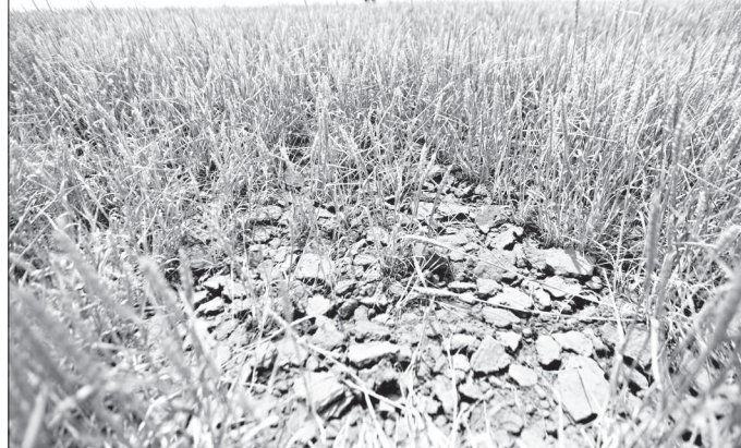
● Засуха - еще одна беда Нефтекумья.

Ж АРКАЯ сухая погода - идеальные условия для массового размножения этих вредителей, особенно на Нефтекумье, располагающем наибольшими площадями пастбищ в крае. В районе обследовано свыше 115 тысяч гектаров, опасные «гости» обнаружены почти на 94 тысячах. В основном это итальянский прус и мароккская саранча, средняя численность которой 29 экземпляров на квадратный метр, а на отдельных участках - в несколько раз больше. Нефтекумцы ведут активную борьбу с этим надоедливым вредителем: обработано почти 37 тысяч гектаров, задействовано 15 единиц специализированной техники, привлекается малая авиация. Один из авиабортотрядов, в частности, работает на полях ОАО «Каясулинское».