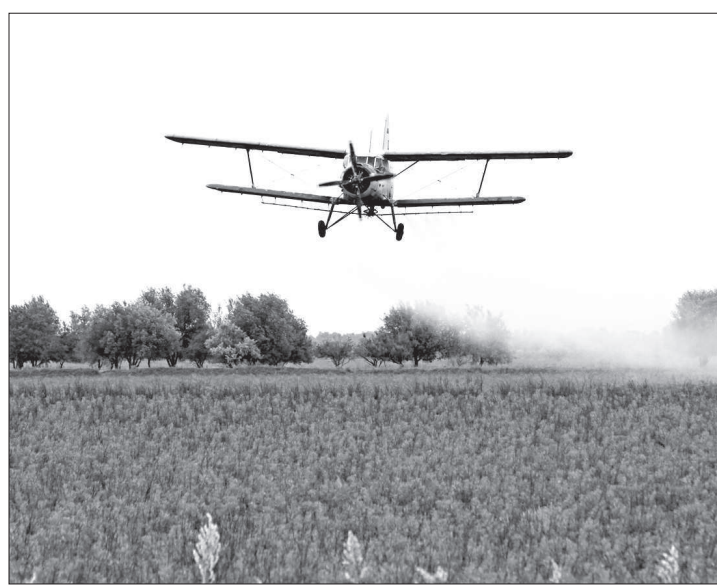
● В борьбе с нашествием саранчи участвует малая авиация.

В трех районах края уже введен режим чрезвычайной ситуации по саранчовым, в том числе в Нефтекумском