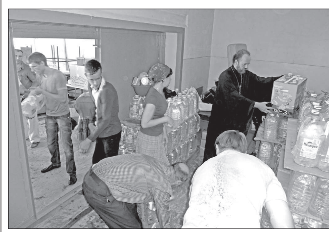
Прихожане и священники ведут погрузку гуманитарной помощи.

Четыре грузовые машины с гуманитарной помощью от Ставропольской и Невинномысской епархии отправлены вчера к пострадавшим от наводнения жителям Кубани.