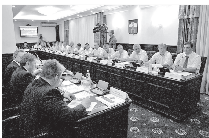
Совещание в администрации Пятигорска.