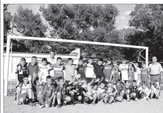
Юные футболисты клуба «Веста» и их тренеры.