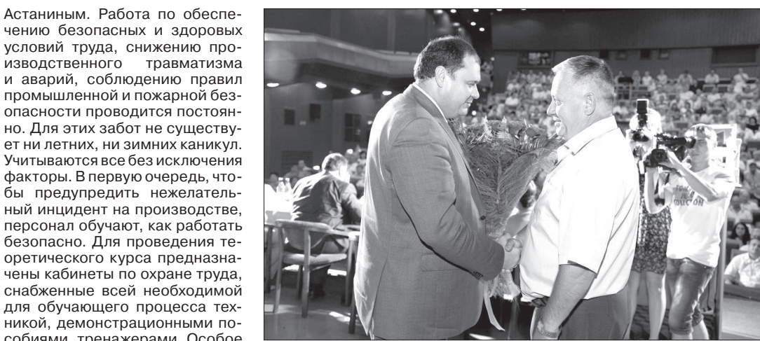
Цветы и слова благодарности - от генерального директора.

Астаниным. Работа по обеспечению безопасных и здоровых условий труда, снижению производственного травматизма и аварий, соблюдению правил промышленной и пожарной безопасности проводится постоянно. Для этих забот не существует ни летних, ни зимних каникул. Учитываются все без исключения факторы. В первую очередь, чтобы предупредить нежелательный инцидент на производстве, персонал обучают, как работать безопасно. Для проведения теоретического курса предназначены кабинеты по охране труда, снабженные всей необходимой для обучающего процесса техникой, демонстрационными пособиями, тренажерами. Особое внимание уделяется улучшению условий работы на опасных объектах. Как говорится, бдительности много не бывает. На этом фоне очень важное значение имеет, как сам работник относится к собственной безопасности. Поэтому не обходится и без воспитательной работы. Сила убеждения - одно из важных качеств, которыми должны обладать и которые должны воспитывать в себе руководители подразделений и инженеры по охране труда.