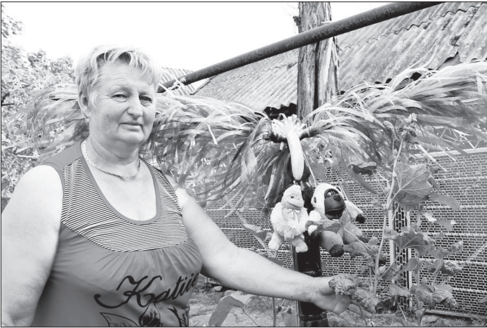
На пальме уютно устроились молодожены - обезьянки Катя и Толя.