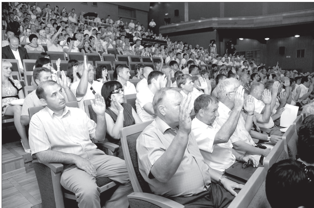
Участники конференции трудового коллектива ООО «Газпром трансгаз Ставрополь».