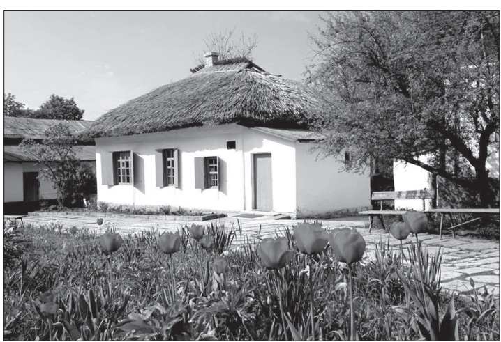
бывший дом генерала Верзилина, в котором часто бывал Лермонтов и где он был вызван на дуэль.

История музея начинается с решения пятигорской городской Думы выкупить домик у очередного владельца.