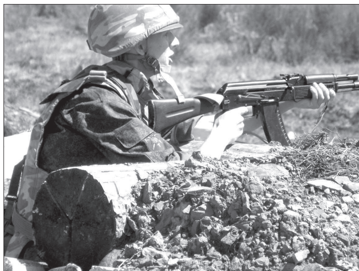
● Отстрелялся на «отлично».