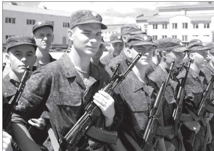
● Валентин Скрипаль.