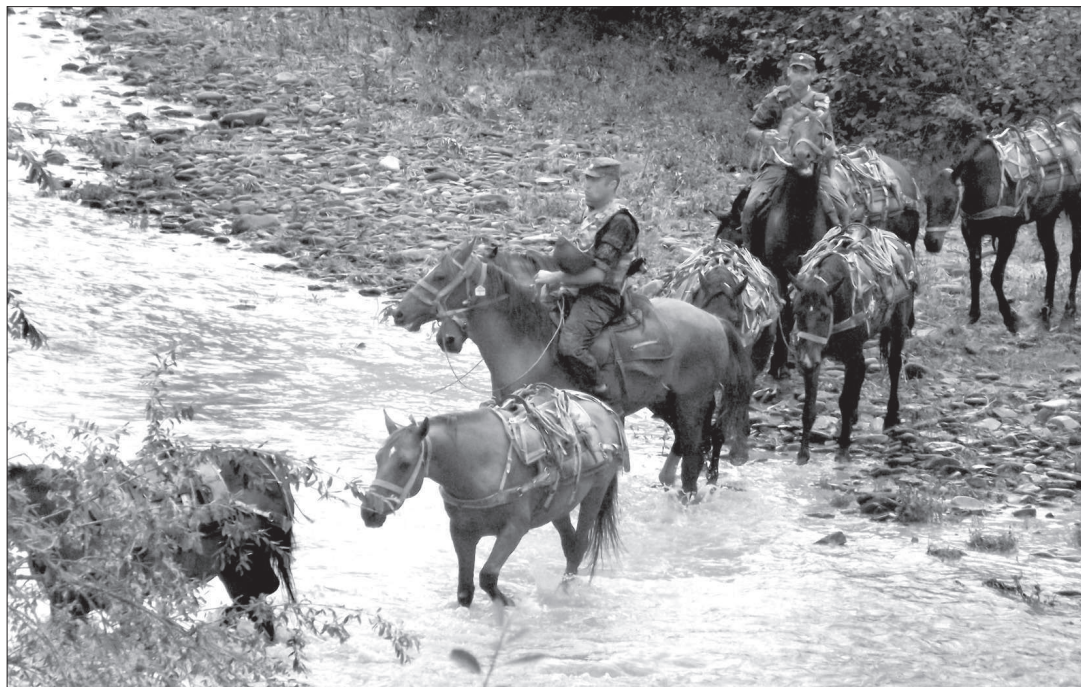
● Вывешивание во время учений.

Удивила и казарма. Впрочем, это слово мало подходит к тому, что увидел. Скорее, общежитие, где помещения разбиты на боксы, в каждом из которых по два кубрика на четыре человека, два умывальника, санузел, душ. В комнатах вместо пресловутой армейской тумбочки у каждого солдата свой шкаф-пенал с личными вещами и формой. Есть письменный стол, стулья. В каждой комнате имеется спортивная комната, гордость подразделения. В роте разведчиков старший сержант Алексей Шевыряев