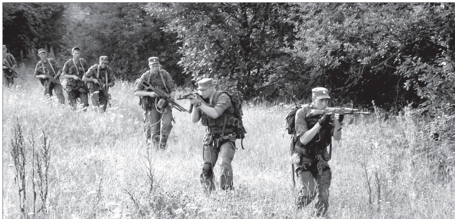
● Разведзвезд на тактических учениях.

Оговорюсь сразу, к армии отношусь с особым пиететом и уважением, не без некоторой доли иронии, разумеется. И именно поэтому хочу предупредить пацифистов, скептиков и других радикально настроенных граждан, что чтение этих заметок не для них. Среди народонаселения бытует мнение, что, мол, вот вывели из Ставропольского края военные части, некому теперь в случае чего нас защитить. Нет. Далеко не так обстоит дела. Сегодняшней публикацией мы открываем цикл статей «Щит Родины», в которых будем рассказывать о наших ставропольских мальчишках, проходящих срочную службу в разных войсковых подразделениях.