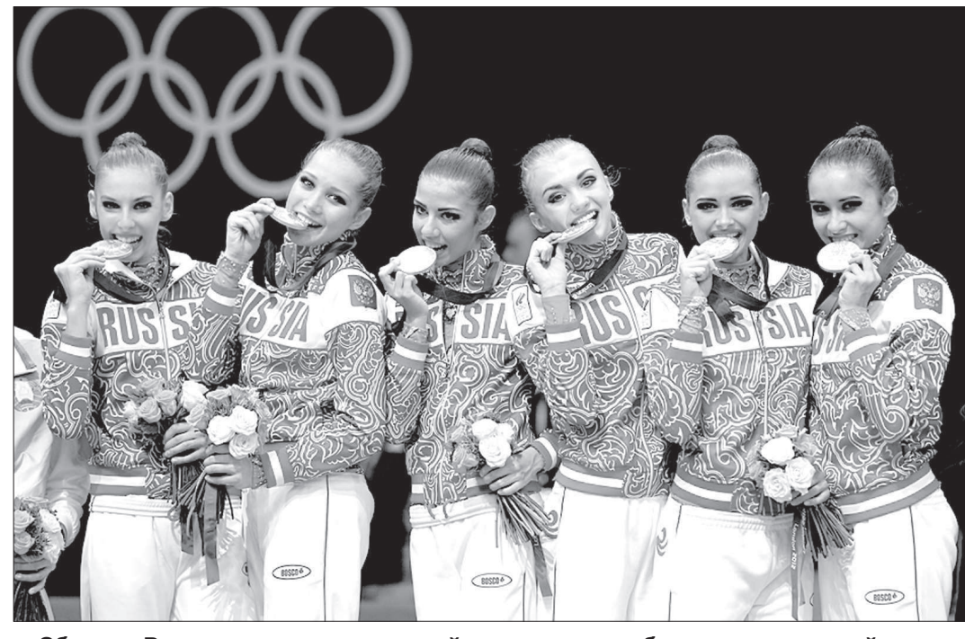
Сборная России по художественной гимнастике - обладатели олимпийского «золота».

Продолжилось соперничество за победу двух россиян в художественной гимнастике - Дарьи Дмитриевой и Евгении Канаевой. И это был еще один повод мечтать о дубле на пьедестале. Так и случилось - две медали в одном виде! «Золото», как всегда, у Канаевой, 17-кратной чемпионки мира и теперь двукратной олимпийской чемпионки! Российские «художницы» вышли в финал групповых соревнований и в четвертый раз стали олимпийскими чемпионками. В синхронном выступлении Наталья Ищенко и Светлана Ромашина сохранили лидерство и после