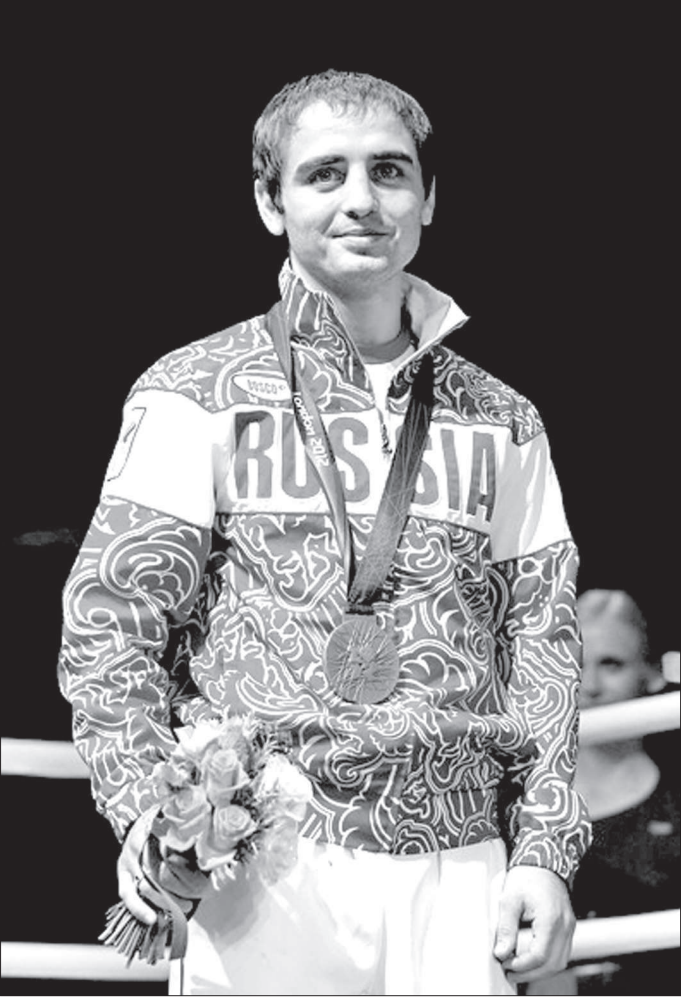
Олимпийская «бронза» Давида Айрапетяна.