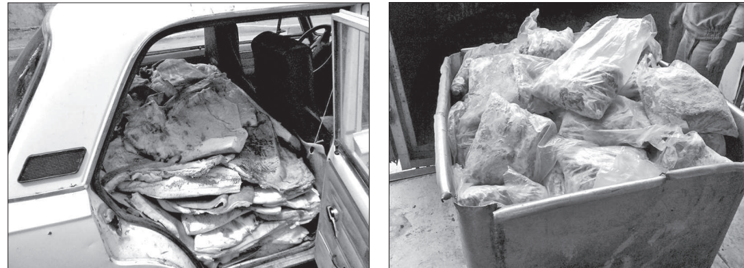
● В таких антисанитарных условиях пытаются незаконно провозить продукты питания.