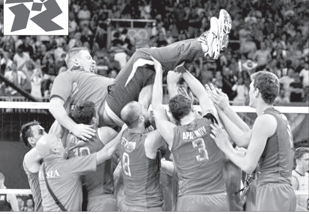
Вolleyболисты сборной России сразу после феноменальной победы над бразильцами.

Вот и погас огонь лондонской Олимпиады, подарившей всему миру столько положительных эмоций, потрясающе захватывающие и неповторимые сюжеты, море слез радости победителей и горечи проигравших!