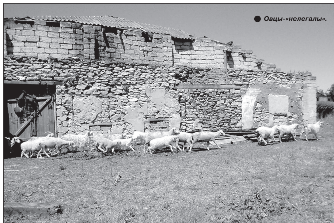
● Овцы - «незаконники».

ского суда останется без изменения, а жалоба без удовлетворения. Владелец животных тем временем постоянно нарушает правила карантина. За это время ветслужбой к нему пять раз приносились меры административного наказания. Создается такое впечатление, что для данного предпринимателя законы не писаны, а управы нет.