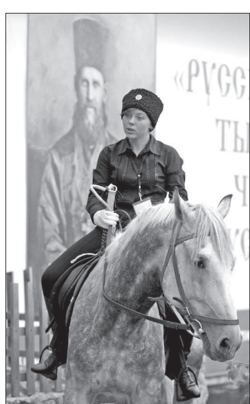
Людмила Ковалевская.