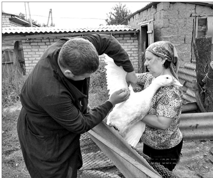
● Ветеринары проводят вакцинацию домашних пернатых от птичьего гриппа.