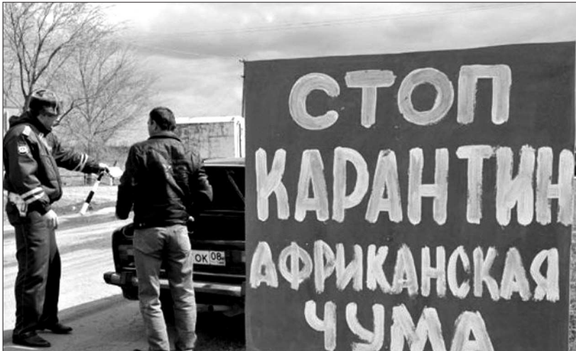
● На постах идет проверка транспорта и груза.

По информации управления ветеринарии СК, за первое полугодие в крае не зарегистрировано ни одного случая африканской чумы свиней. В настоящее время территория края благополучна по АЧС. Вместе с тем эпизоотическая обстановка по данному заболеванию продолжает оставаться напряженной. В целях профилактики возникновения АЧС ежеквартально осуществляются мониторинговые исследования. Всего за 6 месяцев отобрано и исследовано более 2,1 тысячи проб биоматериала от свиноголовья из общественного и частного сектора. Систематически прово-