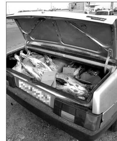
● Ветеринары пресекают попытки незаконного сбыта продукции.

В рамках мониторинга эпизоотической ситуации по африканской чуме свиней с начала нынешнего года организовано более трех тысяч проб биоматериала на африканскую чуму свиней как от домашних, так и диких свиней, - говорит начальник управления ветеринарии - главный ветери-