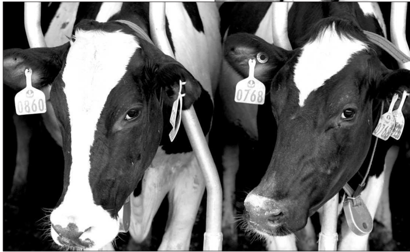
● Вся продукция и на молочно-товарном комплексе, и на перерабатывающем предприятии проходит жесткий ветеринарно-санитарный контроль.

важное значение при этом придается учету поголовья, от которого продукция поступает через заготовителей на молокоперерабатывающие предприятия.