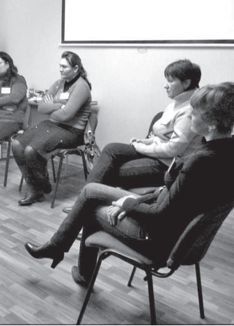
Педагогической помощи замещающим семьям.

С целью повышения профессиональной компетентности специалисты психологических служб системы образования, задействованные в проекте, участвовали в обучающем семинаре «Социально-психологическая модель и технология сопровождения замещающих семей» в Ставрополе. В филиалах Центра для психологов и социальных педагогов был проведен семинар «Технология ведения «Школы приемных родителей». Специалисты посетили также тематические всероссийские семинары, конференции в Москве и Пензе. В 2010 г. «Школа» начала в крае