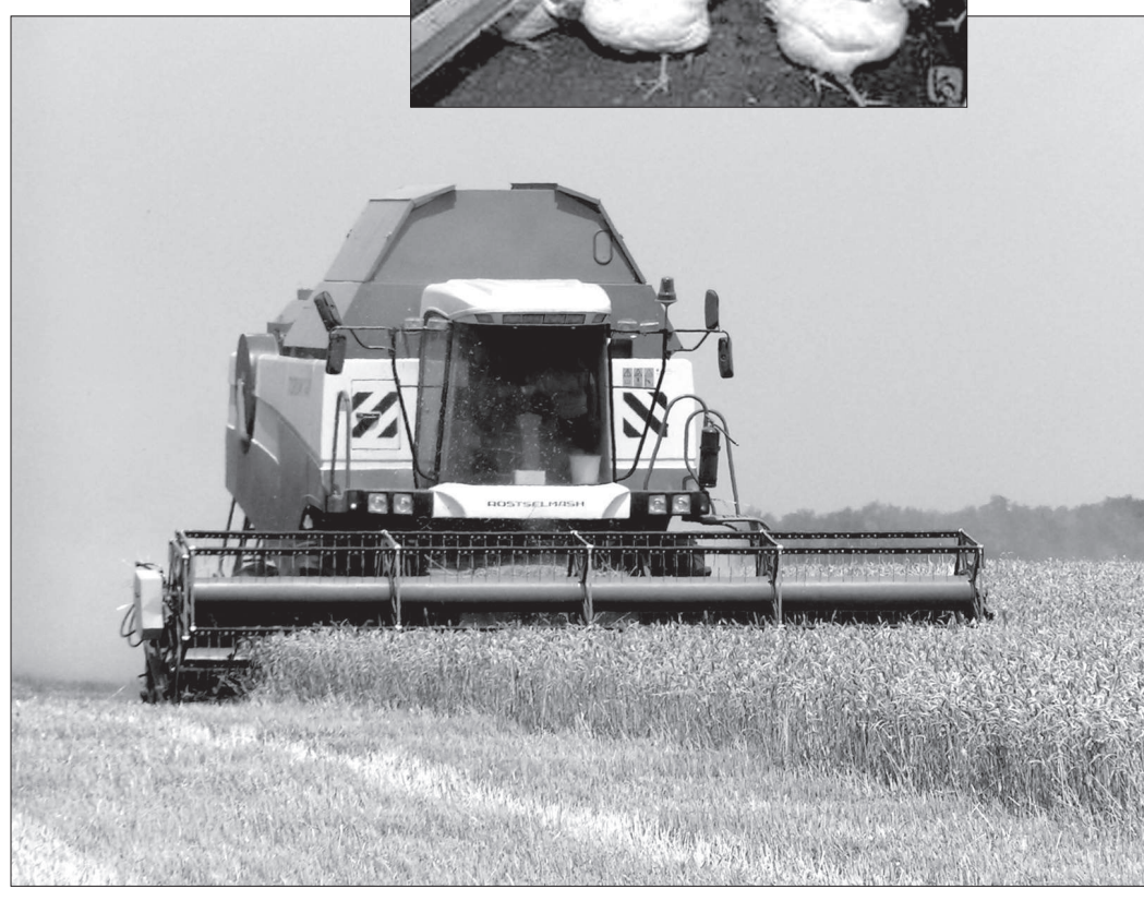
Полосу подготовил АЛЕКСАНДР МАЩЕНКО.

Наша программа, уверен, уже очень скоро даст.