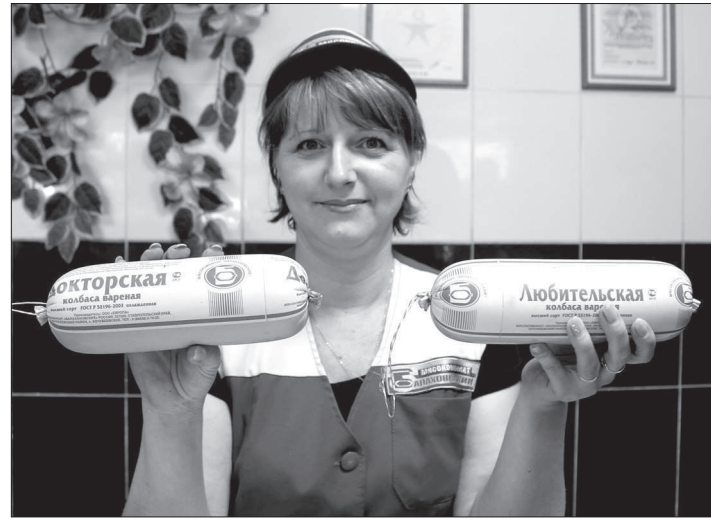
● Балахоновское - значит вкусное и качественное! В фирменном магазине комбината.

Окончательную же оценку продукции дает потребитель. Мяскокомбинат «Балахоновский» имеет развитую сеть фирменной торговли. Только на Ставрополе работает более 45 точек. Есть фирменные магазины и в соседних с краем регионах. Каждый день с предприятия идет отгрузка свежайшей продукции.