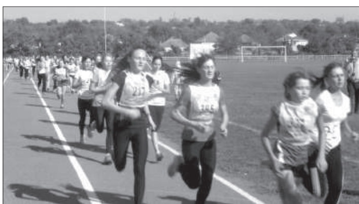
На дистанции забега.

О ОРГАНИЗАЦИИ и проведении спортивно-массовых мероприятий наш край является одним из лидеров в Российской Федерации. Традиционным массовым легкоатлетическим пробегом по улицам села Александровского были подведены итоги летнего легкоатлетического сезона на Ставрополье. 14 октября 2012 года здесь под эгидой министерства физической культуры и спорта СК и в рамках выполнения плана мероприятий по улучшению демографической ситуации в Ставропольском крае на 2011-2015 годы (распоряжение правитель-