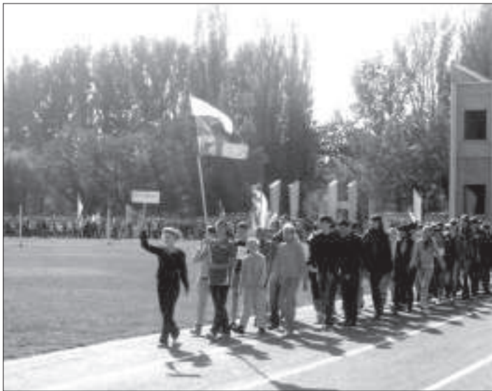
В соревнованиях приняли участие около тысячи юных спортсменов.

Из Древней Эллады до нас дошли прекрасные слова, высеченные на высокой скале: «Хочешь быть красивым - бегай, хочешь быть умным - бегай». Еще до нашей эры их несколько перефразировал великий поэт Рима Гораций: «Если не бегашь, пока здоров, будешь бегать, когда заболеешь». Суммируя смысл обоих выражений, получаем современное «Движение - это жизнь».