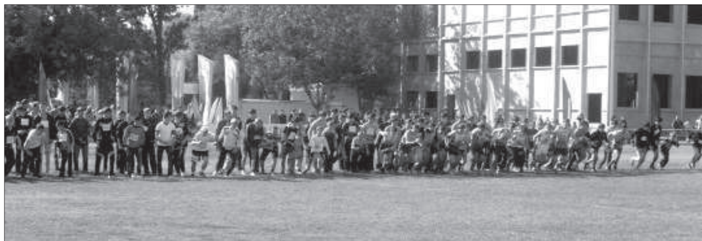
Девиз соревнований - «От массовости к мастерству».

О ОРГАНИЗАЦИИ и проведении спортивно-массовых мероприятий наш край является одним из лидеров в Российской Федерации. Традиционным массовым легкоатлетическим пробегом по улицам села Александровского были подведены итоги летнего легкоатлетического сезона на Ставрополье. 14 октября 2012 года здесь под эгидой министерства физической культуры и спорта СК и в рамках выполнения плана мероприятий по улучшению демографической ситуации в Ставропольском крае на 2011-2015 годы (распоряжение правитель-