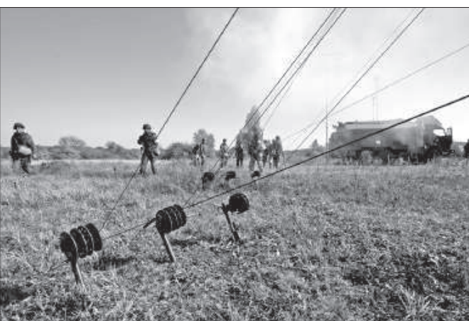
● Развертывание полевых узлов связи на военном полигоне.

В нашем крае военные связи - это войсковая часть № 41600 (бригада управления 49-й общевойсковой армии). Она располагается в Ставрополе на базе бывшего института связи Ракетных войск РФ. Часть существует с 2010 года и формировалась в краевом центре, в ее состав