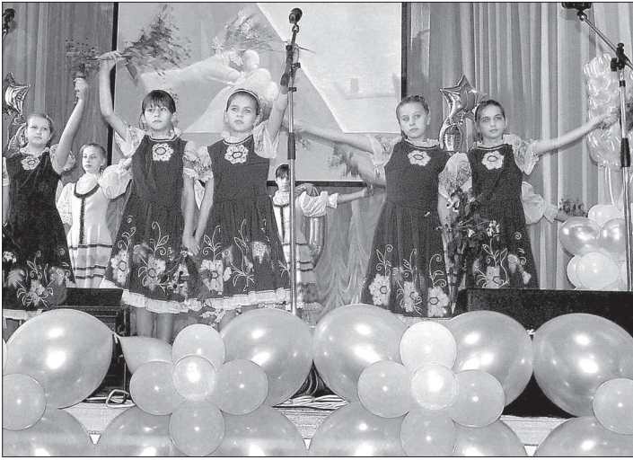
● Выступают юные апанасенковцы.

В Приманьчье состоялся большой праздник – село Апанасенковское отпраздновало 140-й день рождения. Наш сегодняшний рассказ о том, как проходили торжества, о здешних жителях, умеющих и работать, и отдыхать