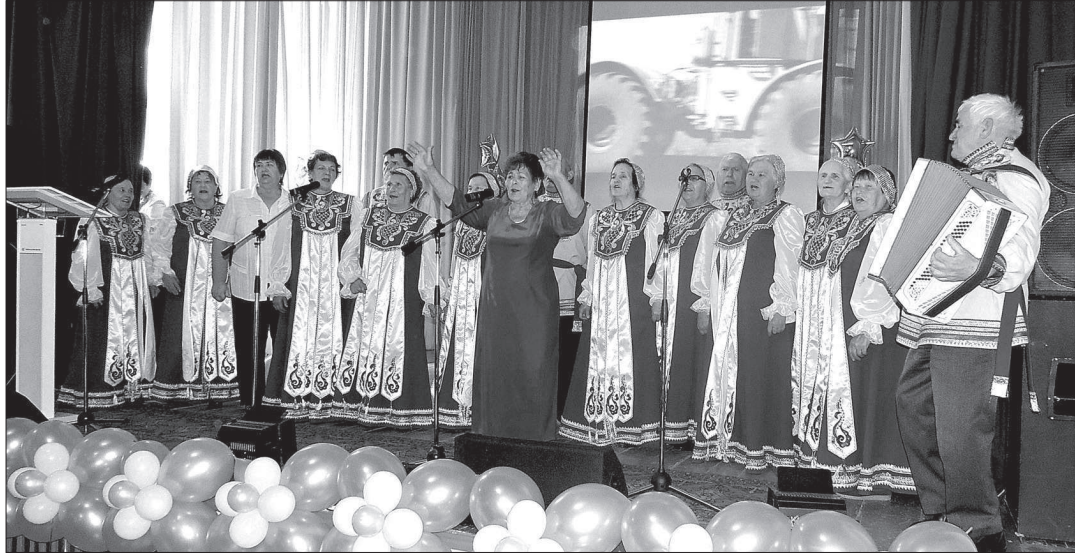
● Поет фольклорный коллектив.