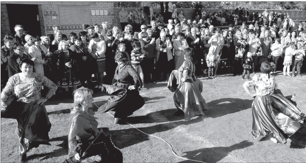
● Цыганский танец.