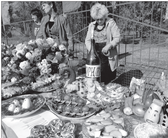
● Стол коллектива социальных работников.