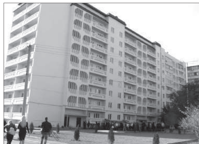
● Новая девятиэтажка, где будут жить и молодые медики.