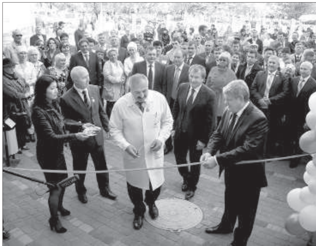
● Торжественный момент открытия поликлиники.