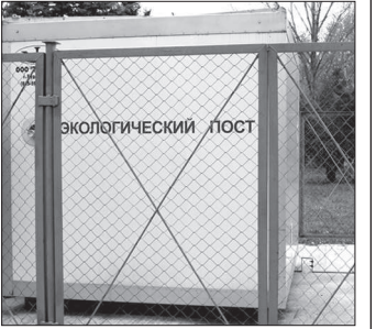
● Экологический пост в селе Кочубеевском вступил в строй.

На днях в Кочубеевском районе произошло событие, значимость которого трудно переоценить. Здесь, в районном центре селе Кочубеевском, на территории центральной районной больницы состоялось торжественное открытие стационарного экологического поста