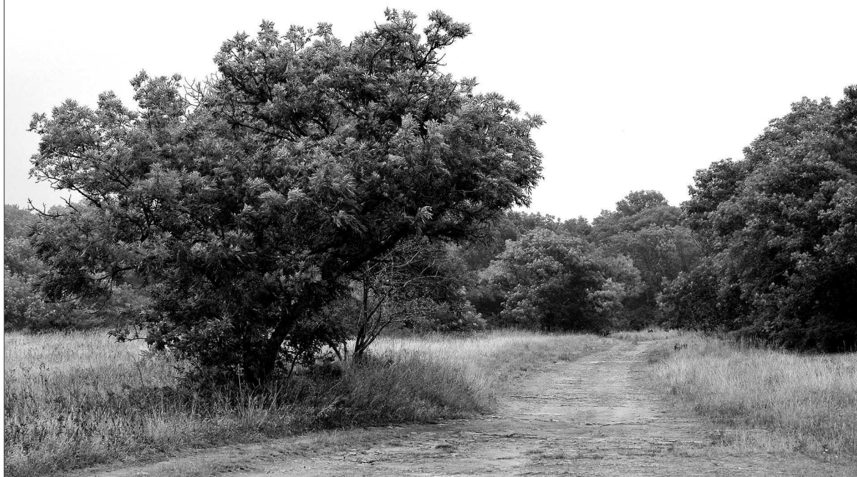
● Русский лес.

Результаты проведенной в 2011 году переписи показали, что численность популяции одного из основных и наиболее популярных объектов охоты в крае зайца-русака снизилась и находится на уровне 81 тыс. особей. Это объясняется тем, что зайц-русак в большей степени подвержен влиянию неблагоприятных факторов среды. Значительная часть его гибнет во время посевных и уборочных работ, при выжигании стерни и пожнивных остатков, а также в результате автокатастроф. Вместе с зайцами уменьшилась численность лисицы - показатели оказались самыми минимальными за последнюю пятилетку - 16581 особь, что можно объяснить резким спадом численности мышевидных грызунов, а также результатом проведенных мероприятий по регулированию численности вида. Судя по учетным данным, численность популяции волка остается довольно высокой - 671 особь. Причем если в предыдущие годы хищник образовывал отнюдь не локальные очаги концентрации в степных и полупустынных восточных и северо-восточных рай-