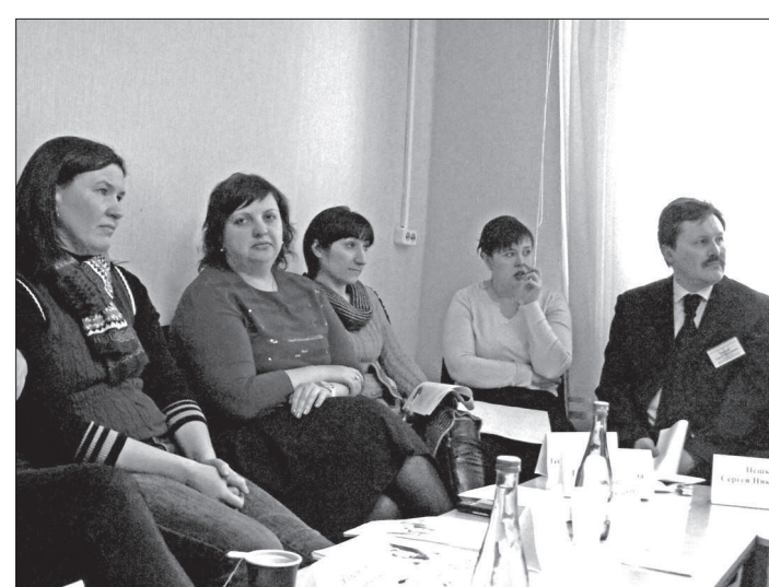
● Круглый стол, посвященный противодействию суициду среди детей и подростков.

рают номер телефона доверия, чтобы задать вопрос, что им делать, но в процессе разговора начинают говорить о своих чувствах, и облегчение приносит именно это. Поделившись пе-