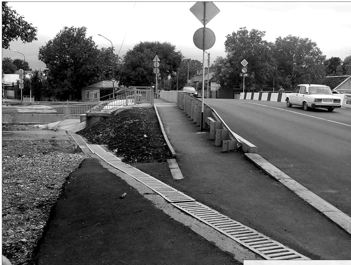
● Так выглядит новый мост в г. Ессентуки.

В предгорьях Кавказского хребта расположен особо охраняемый эколого-курортный регион Кавказские Минеральные Воды. Он уникален по богатству природных ресурсов, и прежде всего месторождений минеральных вод различного химического и газового состава. Среди них знаменитые Славянские и Смирновские источники, кисловодские нарзаны и минеральные воды Ессентуки-4 и 17, радоновые и Нагутские воды. Гидрологическим феноменом можно назвать КМВ по объему запасов минералки (около 16 тысяч кубометров в сутки). КМВ превосходит мировой