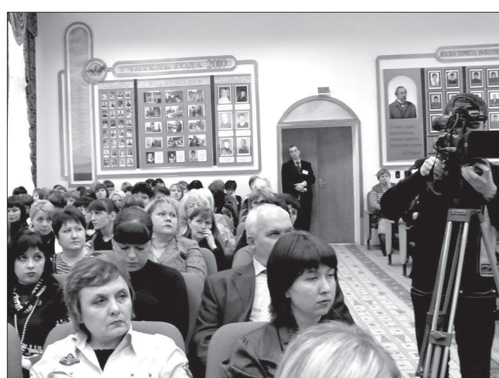
● В министерстве образования края идет семинар психологов на тему жестокого обращения с детьми в семье.

казать, что тот достоин любви, понять его отчаяние. Порой это единственное, чего подросток добивается.