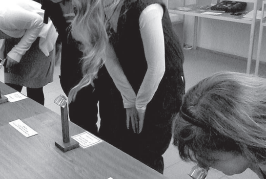
В выставочном зале музея «Крепость».

Другой раз, уже во время рестройки, генсек Горбачев решил удивить Буша-старшего