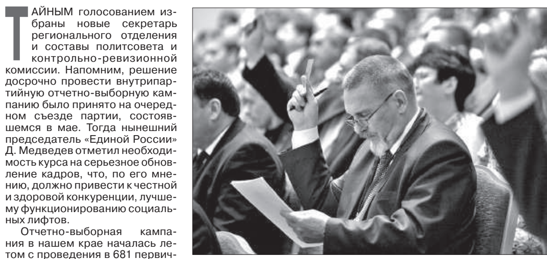
● В зале конференции.