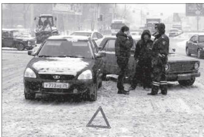
Итаких цитат наберется немало, если «копнуть» архив газеты. Так в чем же причина зимнего пробки на дорогах Ставрополя?