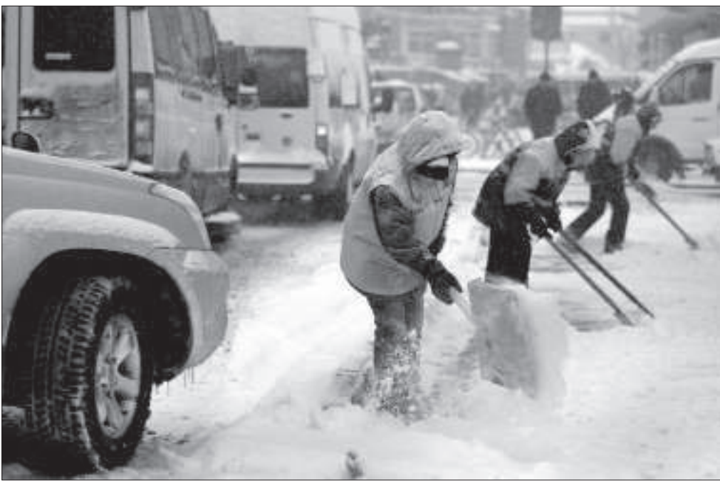
Итаких цитат наберется немало, если «копнуть» архив газеты. Так в чем же причина зимнего пробки на дорогах Ставрополя?

Вчера рабочий день в редакции «Ставропольской правды» начался на час позже обычного, так как к началу планерки большинство сотрудников газеты еще находились в пути. Причиной массового опоздания на работу (уверен, что не только в «СП») стал первый снег, а вернее, вызванный им транспортный коллапс