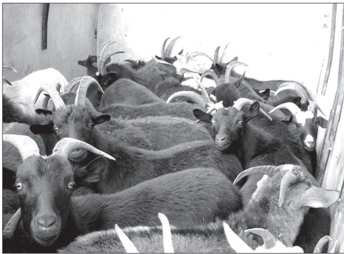
● Пресечение незаконной «миграции» грузов и продукции на территории края.

О ДНОЙ из основных тем встречи стали итоги работы государственной ветеринарной службы Ставрополя по надзору за безопасностью подконтрольной продукции и ее обороту. В заседании приняли участие представители ветеринарных служб, ДПС УГИБДД ГУ МВД России по СК, управления по надзору за исполнением федерального законодательства прокуратуры СК.