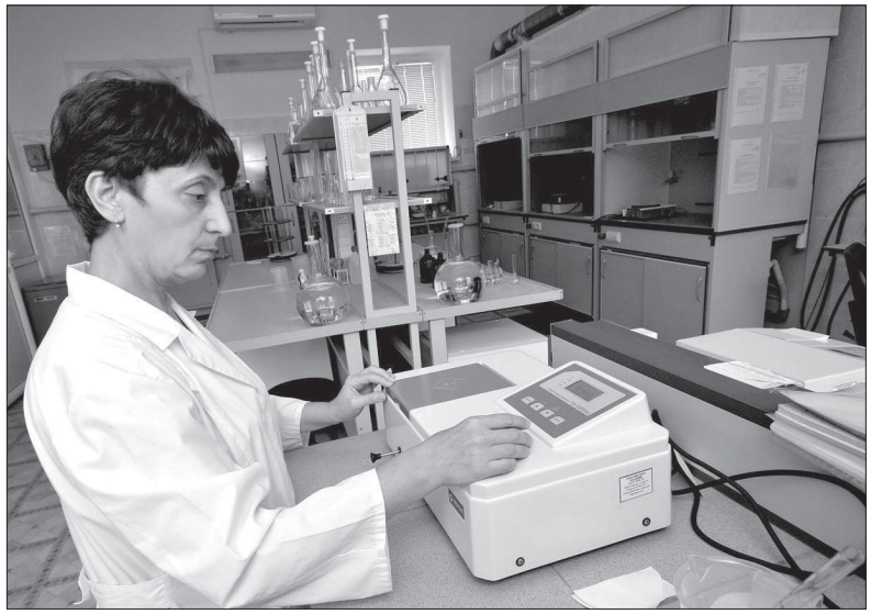
● В лаборатории по контролю за качеством питьевой воды.