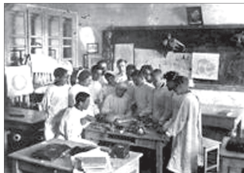
Практические занятия студентов ветеринарного факультета в Ворошиловском зооветеринарном институте, 1940 г.