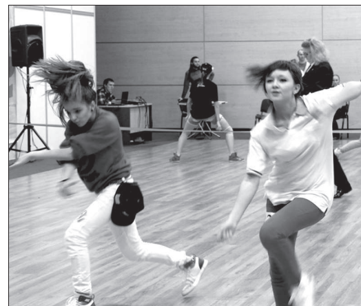
детская малая группа и группа юниоров формейшн (в составе 20 человек!) - стали чемпионами Южного федерального округа, достойно завершив очередной календарный год.