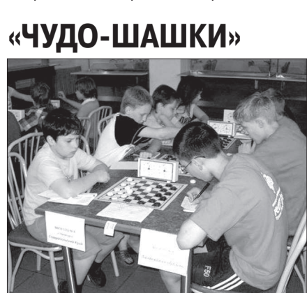
На фото слева - команда СОШ № 8 на финале «Чудо-шашек» в Адлере.

Юные шашкисты Ставрополя (в возрасте не старше 1999 года рождения) готовятся к краевым командным соревнованиям «Чудо-шашки», которые пройдут в дни весенних школьных каникул в Пятигорске в конце марта.