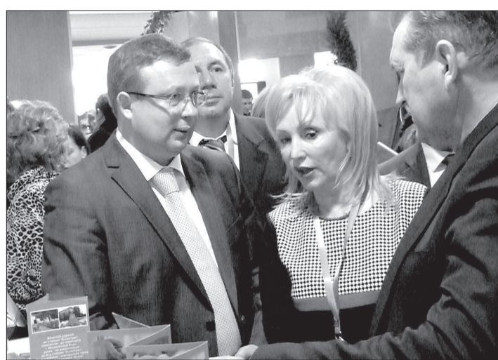
Гости форума на площадке.