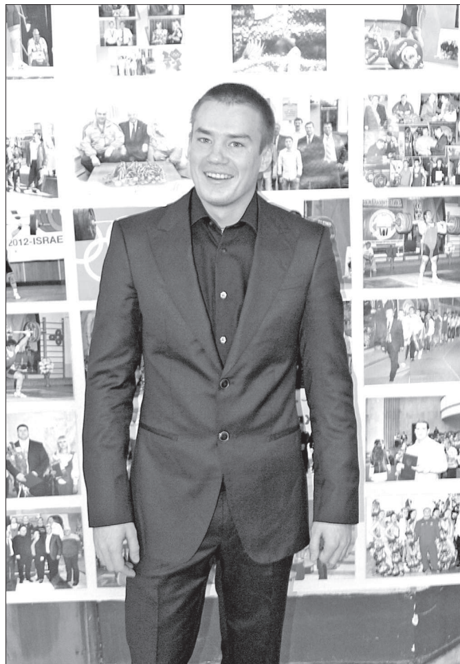
● Серебряный призер Олимпиады-2012 Евгений Кузнецов.