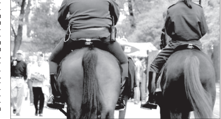
По материалам информационных агентств и корп. «СП».