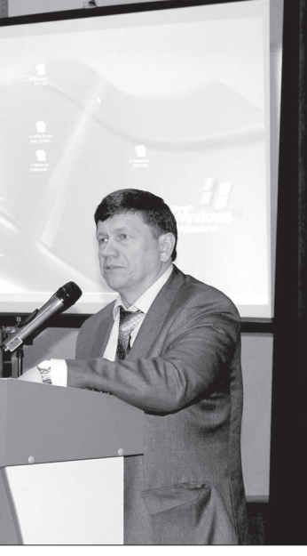
В прошлом году на «Невинномысском Азоте» начала работать первая в России установка по производству меламмина.

Доклады, круглый стол, посещение ОАО «Невинномысский Азот» - два дня форума прошли в напряженной работе.