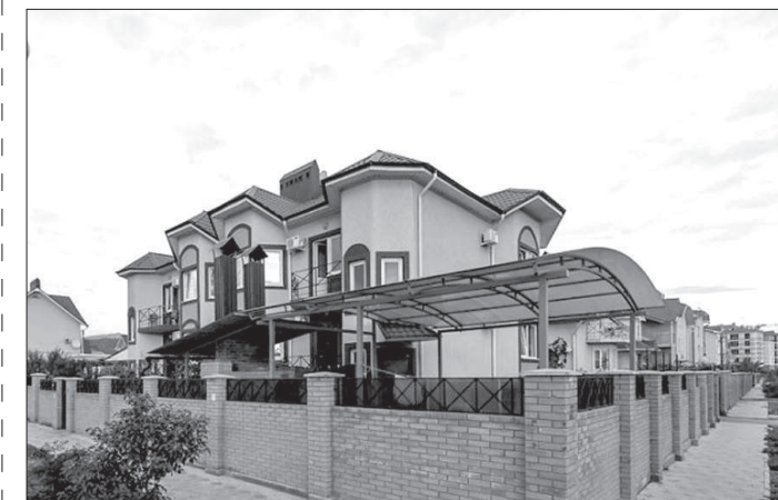
Сочи. Дома для переселенцев.

«ВСЕ, что сейчас вкладывается в инфраструктуру Сочи, имеет отложенный эффект», - сказал он. Положительное влияние на жизнь города в будущем несомненно. Здесь нужно учитывать, что в Сочи объем инвестиций в инфраструктуру города в 4 - 6 раз превышает объем расходов на строительство спор-